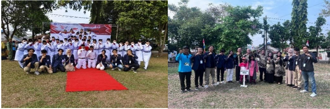
Gambar 2.4 Mahasiswa PKPM IIB Darmajaya mengikuti upacara dalam Rangka HUT RI Ke-79