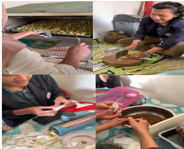
Gambar 2.2 Ikut serta dalam pembuatan Teh

Mahasiswa ikut langsung Pembuatan dan pengemasan Pembuatan teh serai 100% menggunakan bahan serai yang di potong” dan di oven kemudian di kemas