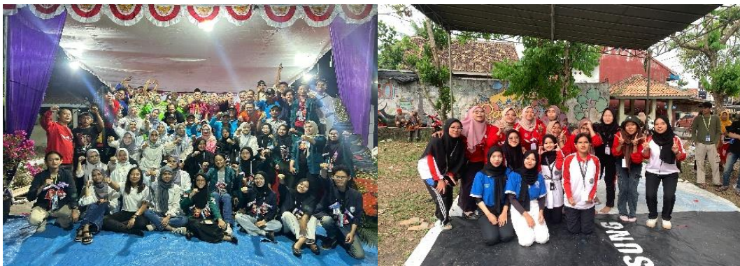
Gambar 2.5 Berpartisipasi Menjadi Panitia HUT RI

Berpartisipasi dalam kegiatan yang diselenggarakan oleh RW02 Sampai RW13 dalam memeriahkan HUT RI Ke-78 dengan berbagai macam perlombaan