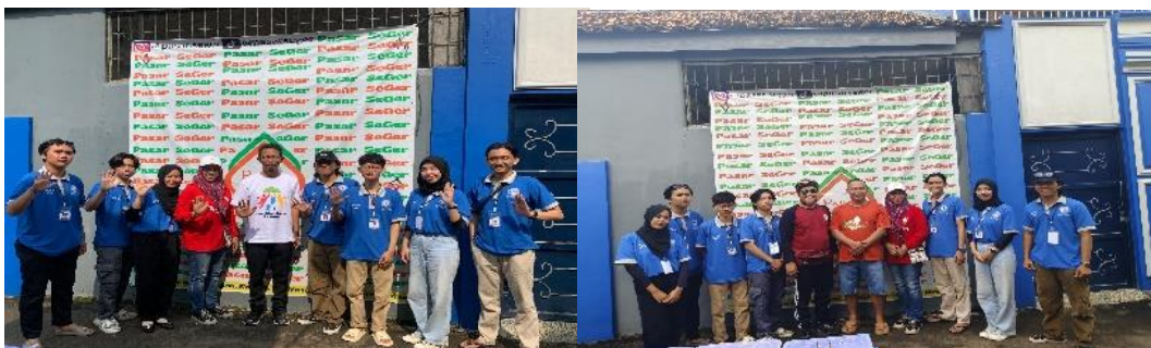
Gambar 2.3 Kegiatan Gelaran Pasar Seger yang dilaksanakan Setiap Bulan sekali di minggu Pertama

Kegiatan rutin yang dilakukan oleh Warga RW 08 yang dilaksanakan Setiap Bulan sekali di minggu pertama