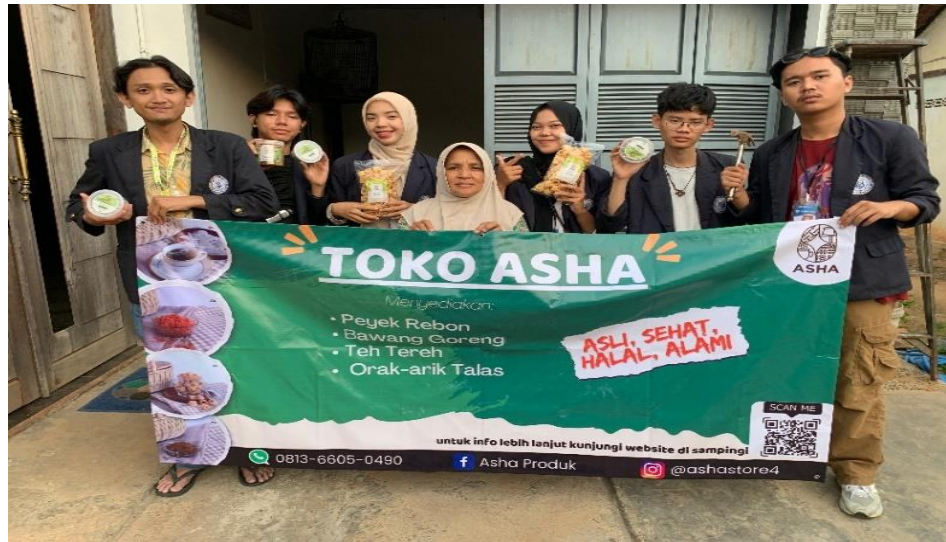
Gambar 2.6 Penyerahan Banner kepada UMKM ASHA

Banner ini nantinya digunakan sebagai identitas dan sebagai penanda bagi para pelanggan dan juga calon pelanggan agar mengetahui lokasi dan jenis usaha yang di jalankan