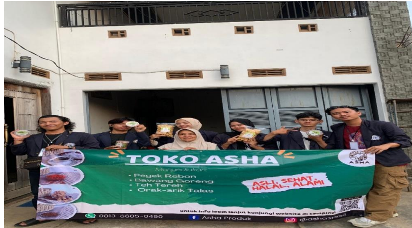
Gambar 2.3 Ikut serta Dalam pembuatan dan pengemasan Teh Serai