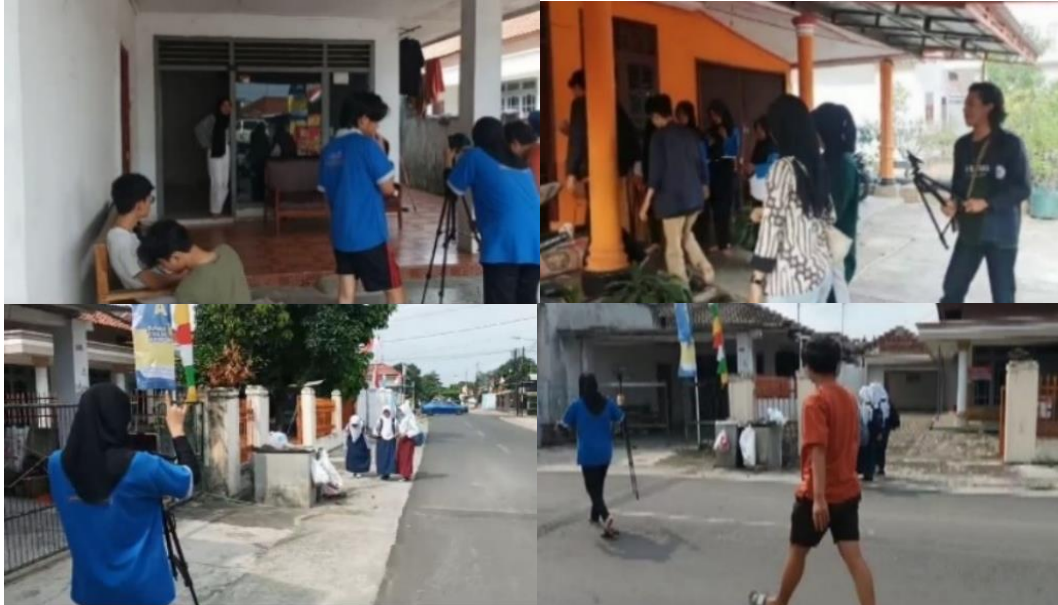
Gambar 2.7 Proses Pembuatan Iklan Layanan Masyarakat