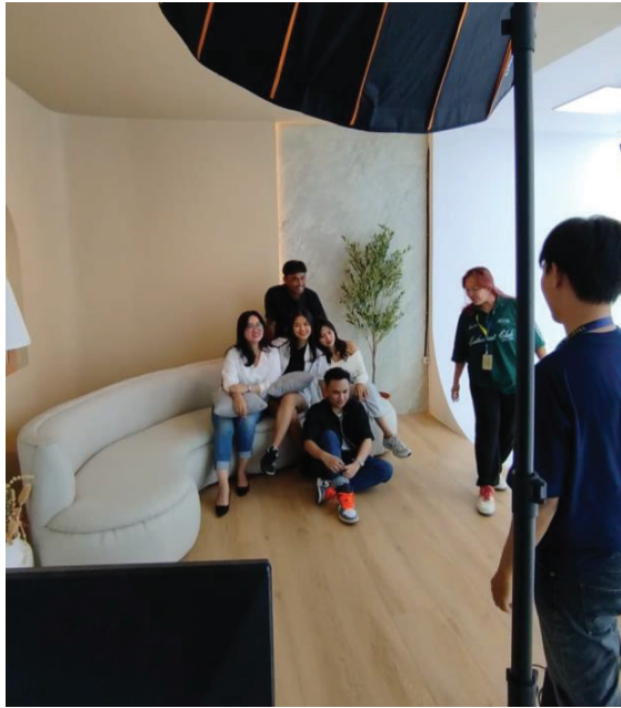
Lampiran.3 Kegiatan Selama KP