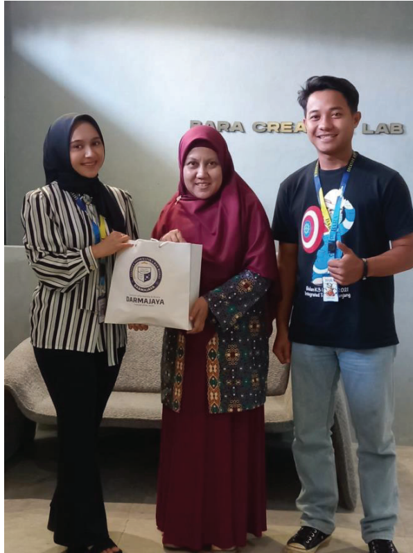
Lampiran.1 Pengantaran Mahasiswa KP