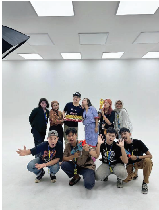
Lampiran.4 Kegiatan Selama KP