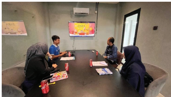
Lampiran.2 Pemaparan Hasil KP