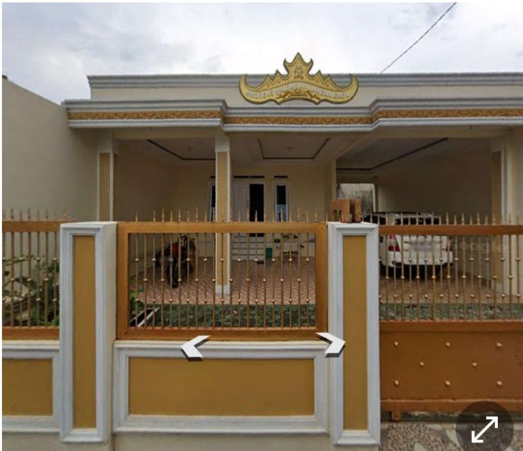
Gambar 1 Lokasi Perusahaan

Berikut Kerja Praktek dilaksanakan di kantor Koperasi Riauli Mandiri yang beralamatkan di Perumahan Polri Hajimena, Gang Melati IV Blok B10 No. 5, Natar, Kab. Lampung Selatan, Lampung 35362.