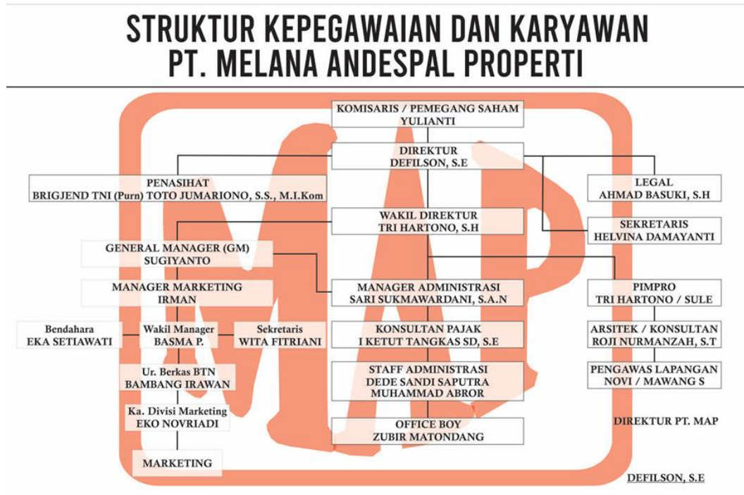
Gambar 2.2 Struktur Organisasi

Perusahaan ini tidak memiliki struktur organisasi karena perusahaan saat ini tidak memiliki karyawan yang banyak, tetapi tanpa adanya struktur organisasi perusahaan ini berjalan dengan lancar dengan semestinya.