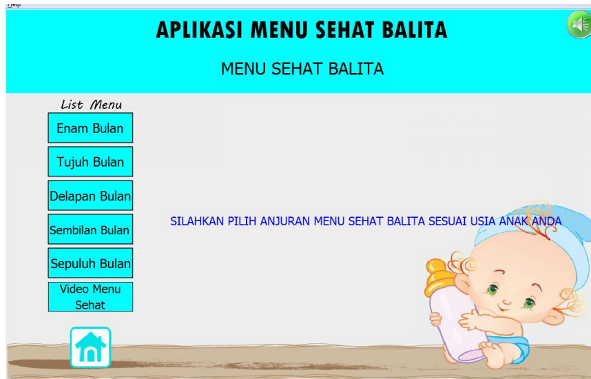
Gambar 4.3 Menu Sehat Balita