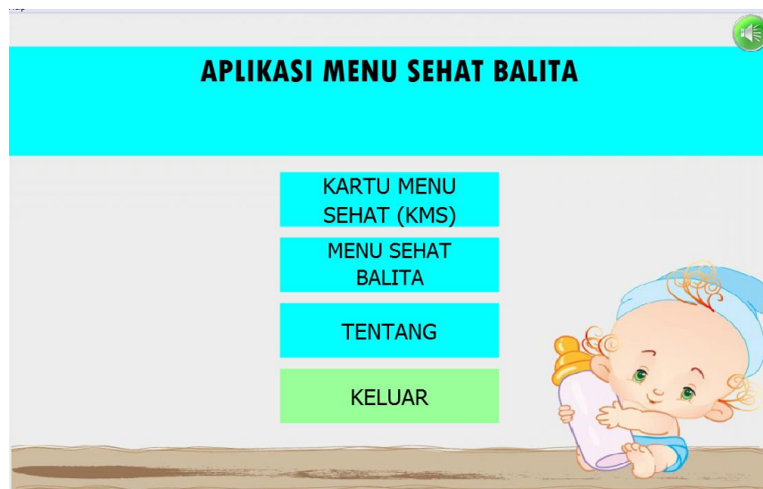
Gambar 4.1 Tampilan Menu Utama

Halaman ini merupakan halaman default yang akan ditampilkan pertama kali ketika user atau pengunjung membuka aplikasi. Didalam halaman ini terdapat juga beberapa pilihan menu antara lain: cek gizi balita, menu sehat balita, tentang dan keluar. Gambar 4.1 Menunjukkan Tampilan Menu Utama Aplikasi.