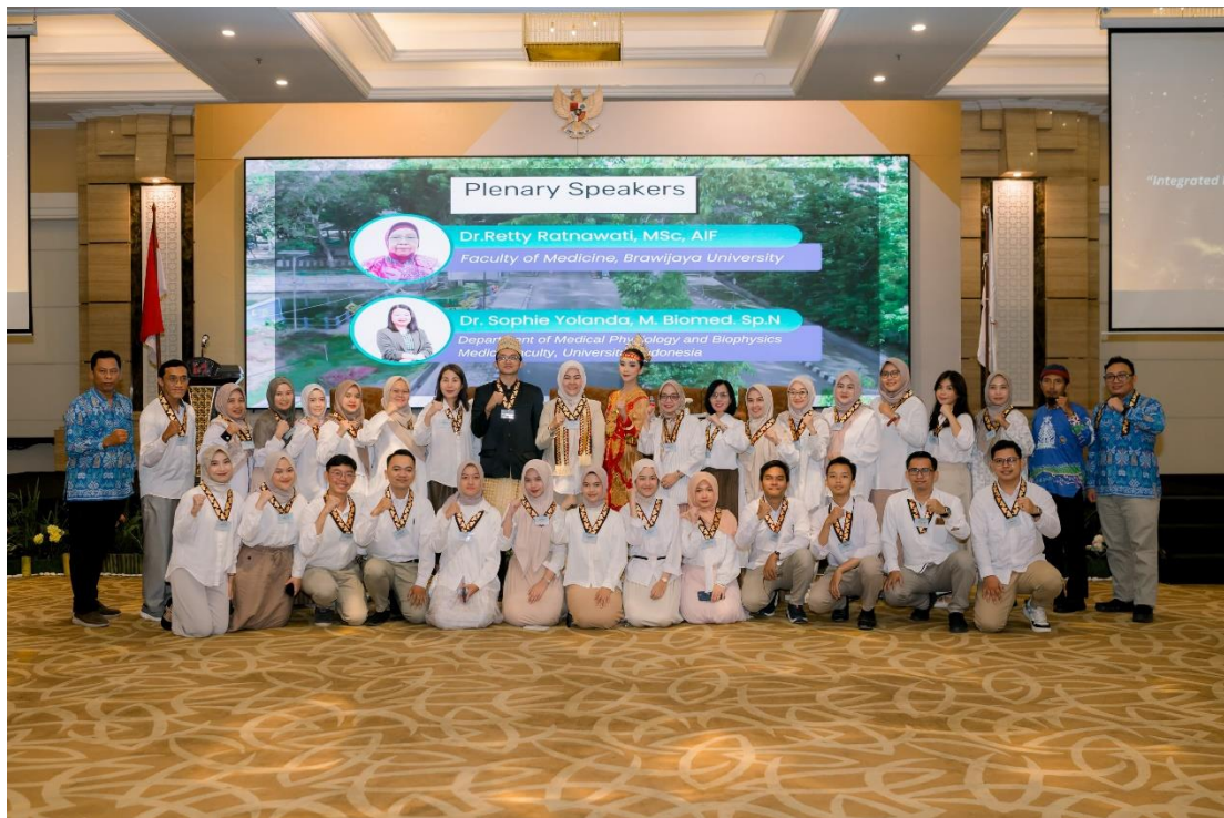
Foto bersama panitia konferensi INSPIGHRES