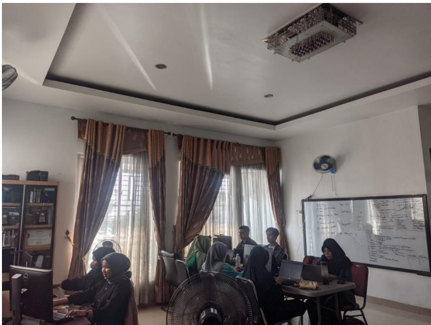
Suasana ruang magang