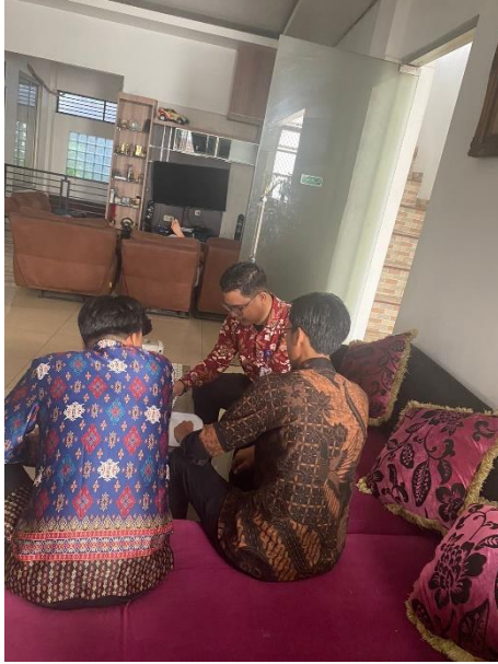
Diskusi pembuatan website