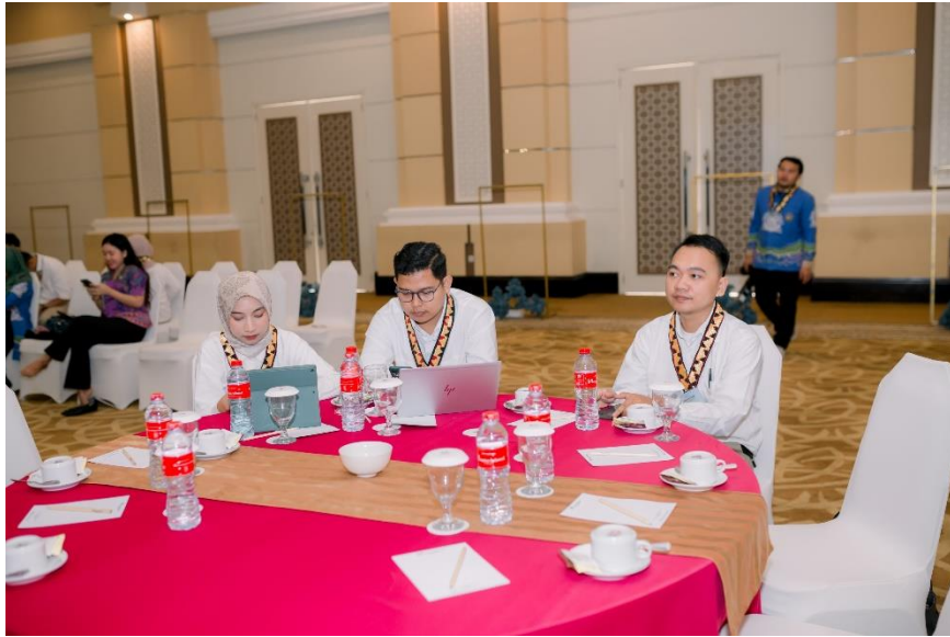
Menghadiri Konferensi Internasional di Swill-bel Hotel