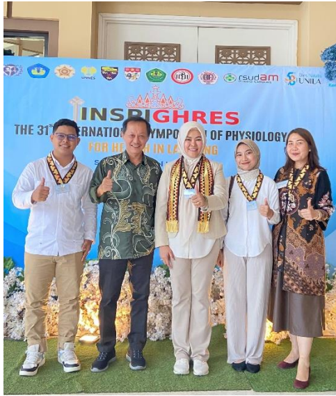
Foto bersama narasumber INSPIGHRES