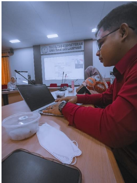
Rapat persiapan konferensi di Unila