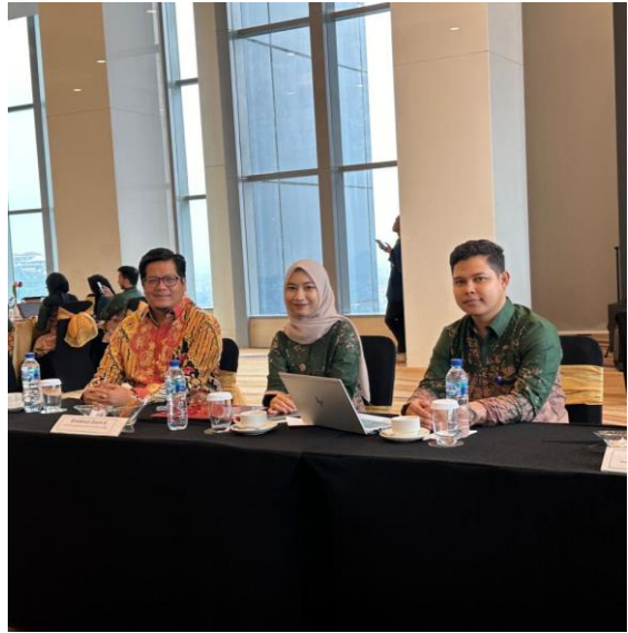
Kegiatan Seminar Nasional di Grand Mercure Lampung