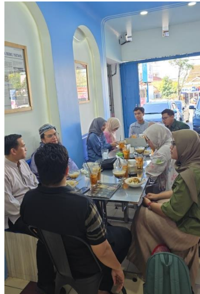
Rapat persiapan konferensi di Goodwood Publishing