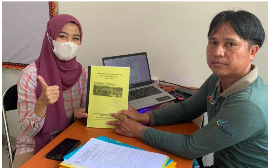
Keterangan: Observasi & Wawancara 1 Agustus 2022