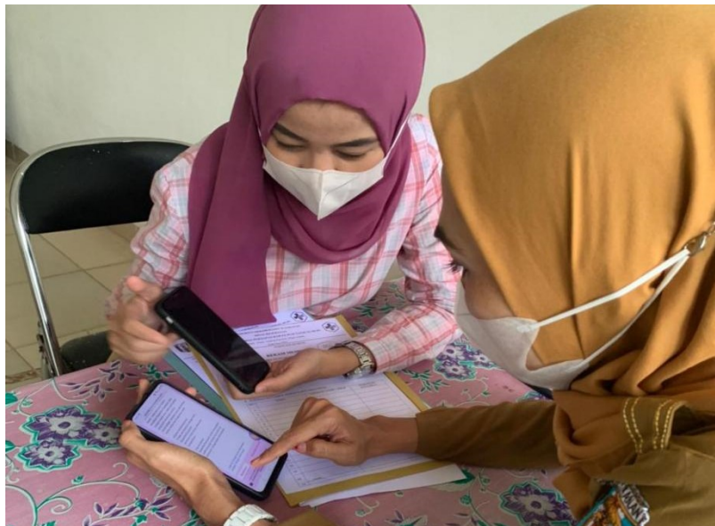
Keterangan: Pendistribusian Kuesioner Kepuasan Kerja & Disiplin Kerja kepada Pegawai tanggal 1 Agustus 2022