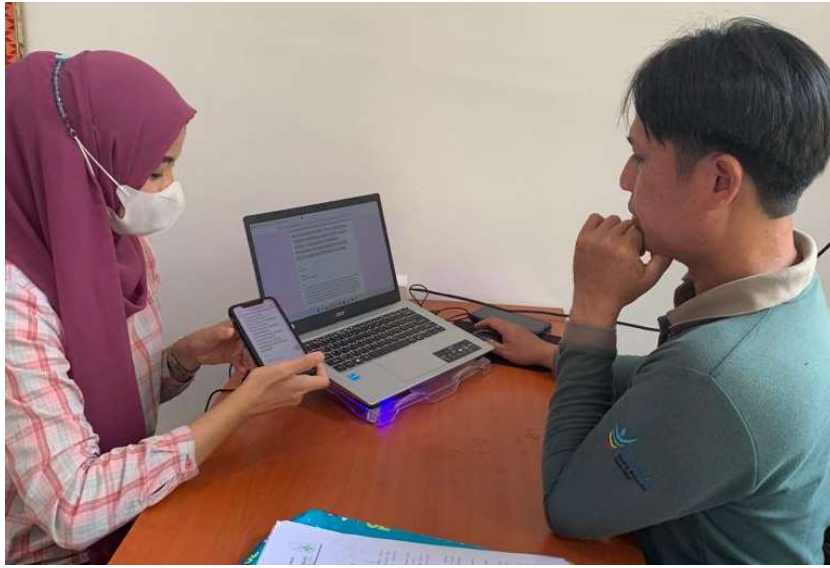
Keterangan: Pendistribusian Kuesioner Kinerja Pegawai kepada Kepala Puskesmas tanggal 1 Agustus 2022