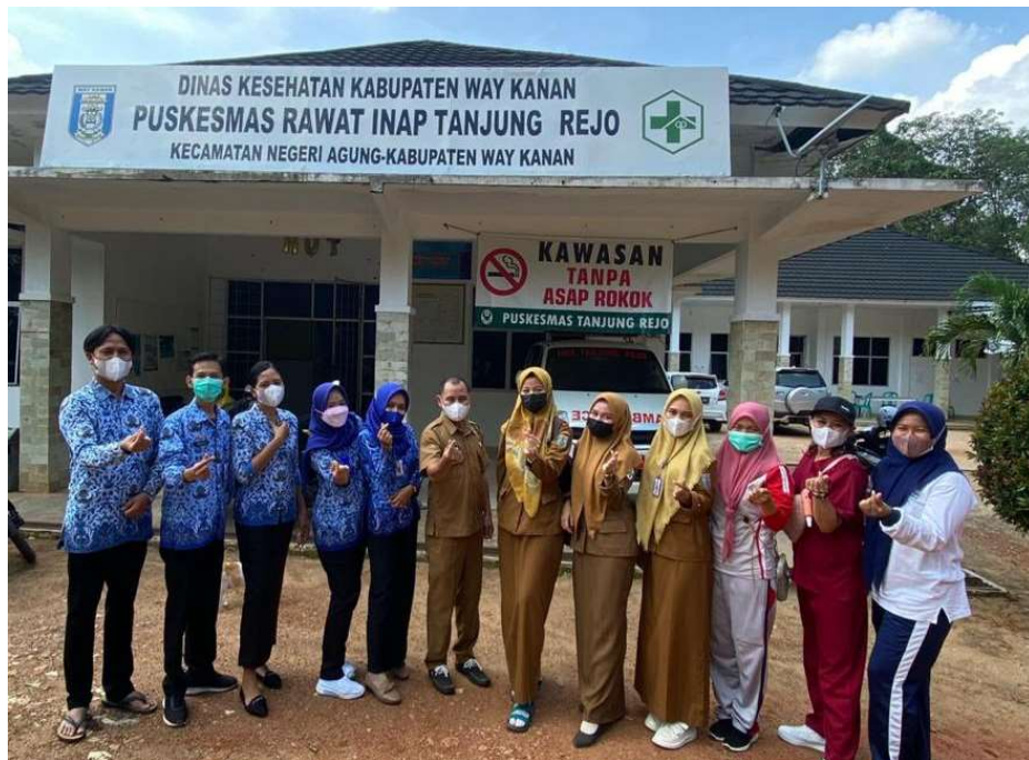
Keterangan: Izin Penelitian tanggal 18 Juni 2022