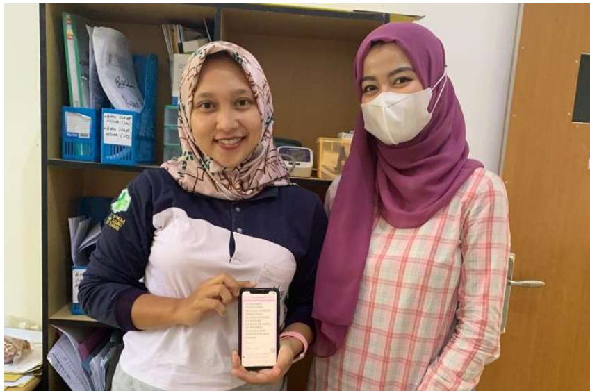
Keterangan: Pendistribusian Kuesioner Kepuasan Kerja & Disiplin Kerja kepada Pegawai tanggal 1 Agustus 2022