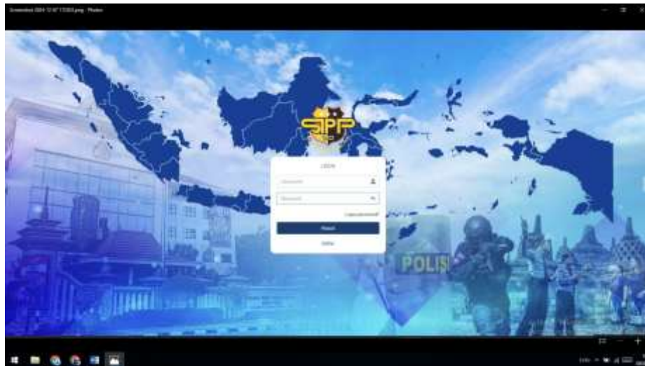
Gambar 4.1. Tampilan Form Login

Login aplikasi ini memiliki akses login user dan admin yang masing – masing akan di arahkan sesuai hak account login yang akan menampilkan akses menu-menu tersendiri. Tampilan halaman login ini dapat dilihat pada Gambar 4.1. berikut :