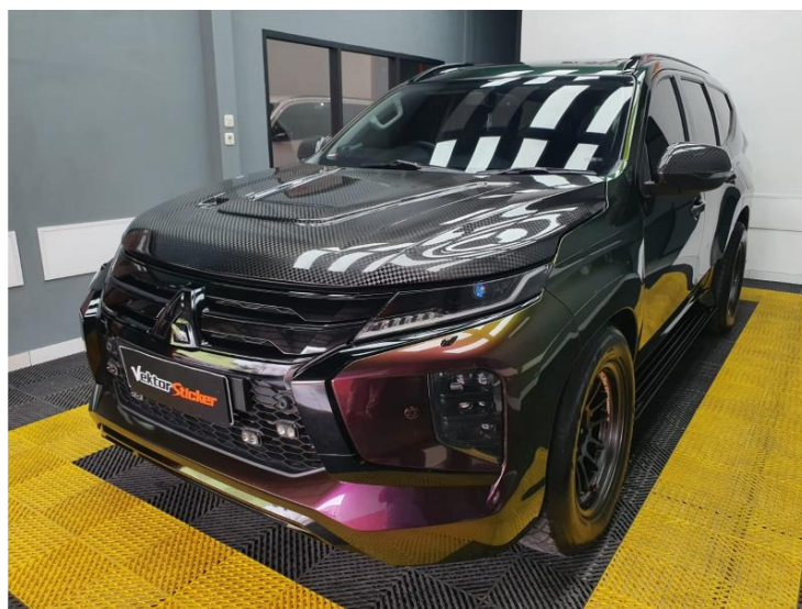
(Gambar 3.2.4. [1] Wrapping Color)

Wrapping mobil adalah teknik menutupi cat mobil dengan bahan vinyl khusus untuk memberikan tampilan yang baru. Proses ini melibatkan pemasangan lapisan vinyl yang dirancang untuk menutupi seluruh permukaan kendaraan, dari kap mesin hingga bumper. Wrapping dapat dilakukan untuk berbagai tujuan, mulai dari perubahan estetika, perlindungan cat asli, hingga promosi merek melalui desain grafis[6].