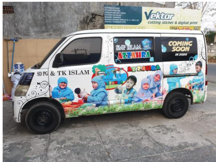
(Gambar 3.2.2. [1] Branding Mobil)

Branding mobil adalah aktivitas promosi yang menggunakan mobil atau kendaraan sejenisnya sebagai media iklan. Metodenya yakni dengan mengaplikasikan design branding produk pada kendaraan, design branding dicetak dalam media sticker dengan ukuran yang sesuai dengan kendaraan, selanjutnya sticker kemudian di wrapping ke body kendaraan. [1].