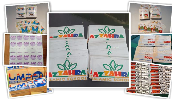
(Gambar 3.2.3. [1] Cutting Sticker)

Cutting sticker adalah teknik memotong bahan stiker sesuai desain yang dikehendaki, termasuk permainan warna solid/nongradasi ataupun pada coraknya. Teknik memotong ini dilakukan dengan bantuan mesin cutting sticker sekaligus komputer sebagai media desainnya. Hasil cetak cutting sticker dapat digunakan di mana saja, dari mulai dijadikan tempelan untuk barang-barang pribadi hingga dijadikan label kemasan produk [5].