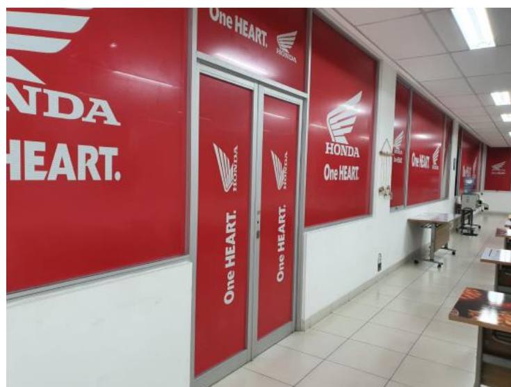
(Gambar 3.2.2. [1] Printing)

Printing adalah salah satu teknik percetakan yang saat ini kerap diaplikasikan dalam pembuatan tulisan, gambar, komposisi warna, hingga ilustrasi pada sebuah media cetak. Produk yang dihasilkan perusahaan tidak bisa lepas dari percetakan [4].