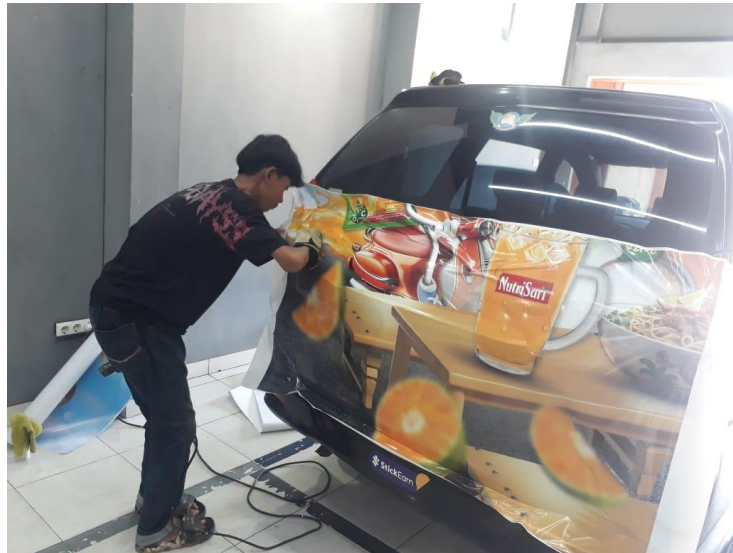
(Gambar 4.5. [8] Proses Pemasangan Sticker)

Setelah melalui proses cetak selanjutnya sticker di aplikasikan pada body kendaraan sesuai dengan pola yang di tentukan, proses pemasangan memakan waktu 2 hari untuk branding full kendaraan.