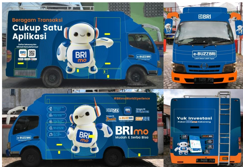
(Gambar 4.4. [5] Konsep Branding Mobil)