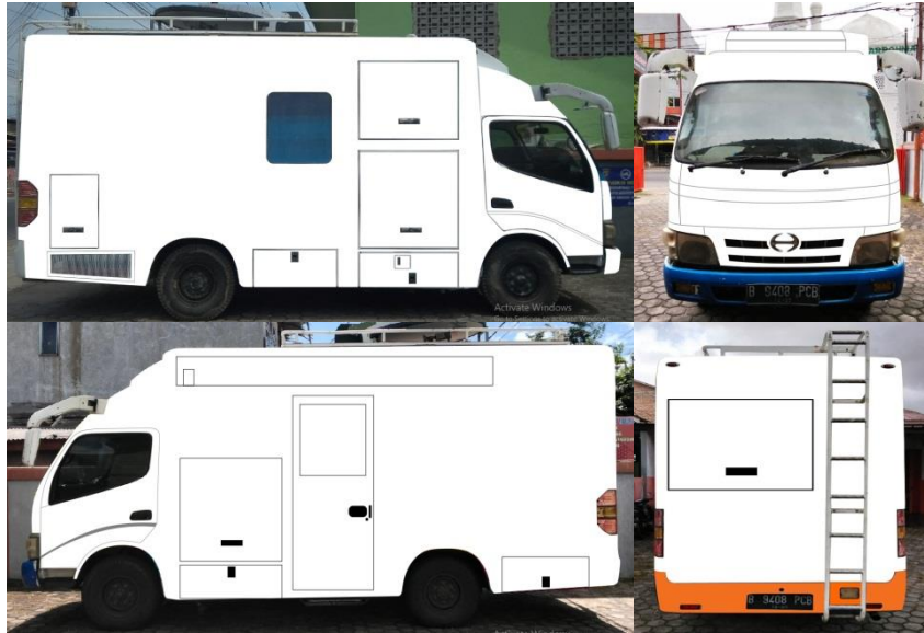
(Gambar 4.2. [3] Scaling Foto Mobil Pada CorelDraw)

Selelah melakukan pengukuran selanjutnya, adalah mencari skala mobil di software CorelDraw dengan cara import foto mobil, selanjutnya melakukan scaling sesuai dengan ukuran yang sudah diukur sebelumnya.