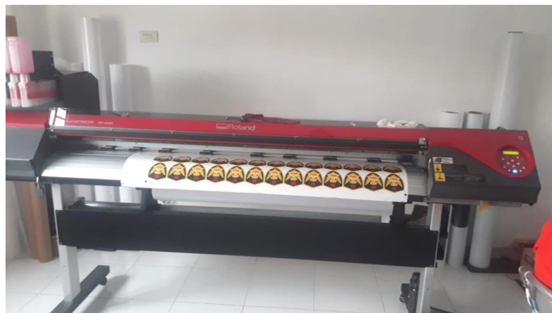
(Gambar 4.5. [7] Proses Cetak Sticker)

Tahap cetak sticker adalah tahap yang dilakukan setelah konsumen deal dengan desain branding mobil dan sudah melakukan pembayaran, design diexport dalam bentuk JPG guna di import kedalam software mesin operator.