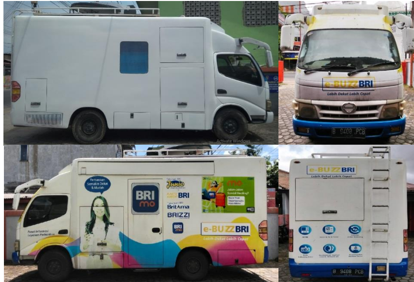
(Gambar 4.2. [2] Foto Mobil dengan Presisi)