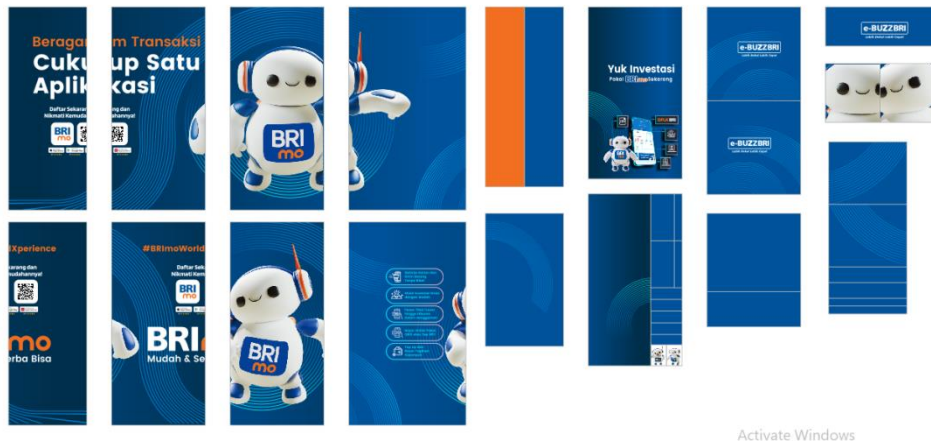
(Gambar 4.4. [6] Proses Plot Habis Bahan)

Setelah melakukan desain branding, selanjutnya adalah menghitung habis bahan untuk menjumlah total biaya branding, tahap ini disebut dengan tahap plot sticker menggunakan bahan media cetak sticker plot dapat dilakukan dengan ukuran 100cm, 120cm dan 150cm.