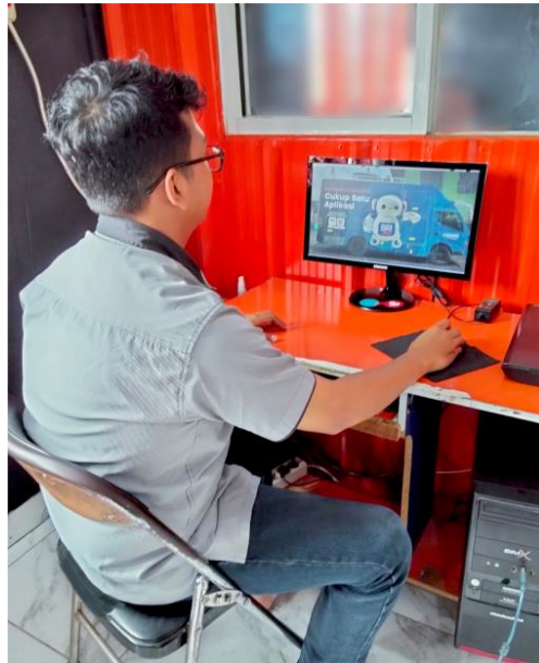
(Gambar 4.3. [4] Desain Branding Mobil)

Desain branding pada kendaraan dilakukan sesuai dengan permintaan konsumen., Pada tahap ini desain aplikasikan pada kendaraan dengan skala real mobil, desain dilakukan dengan cara mencari konsep, memilih typografi, mengkobinasi warna, pencarian gambar dengan resolusi tinggi, menampilkan foto produk, nama produk dan informasi produk, semua materi dikemas dalam satu desain branding.