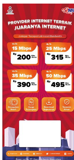
Gambar 1. Brosur Internet