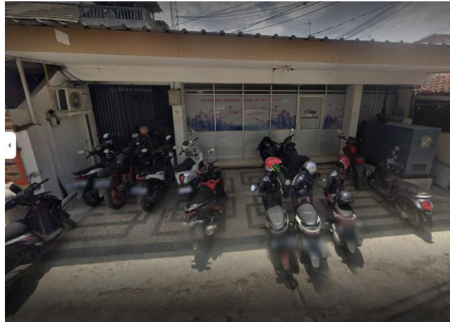
Gambar 2. Kantor Operasional