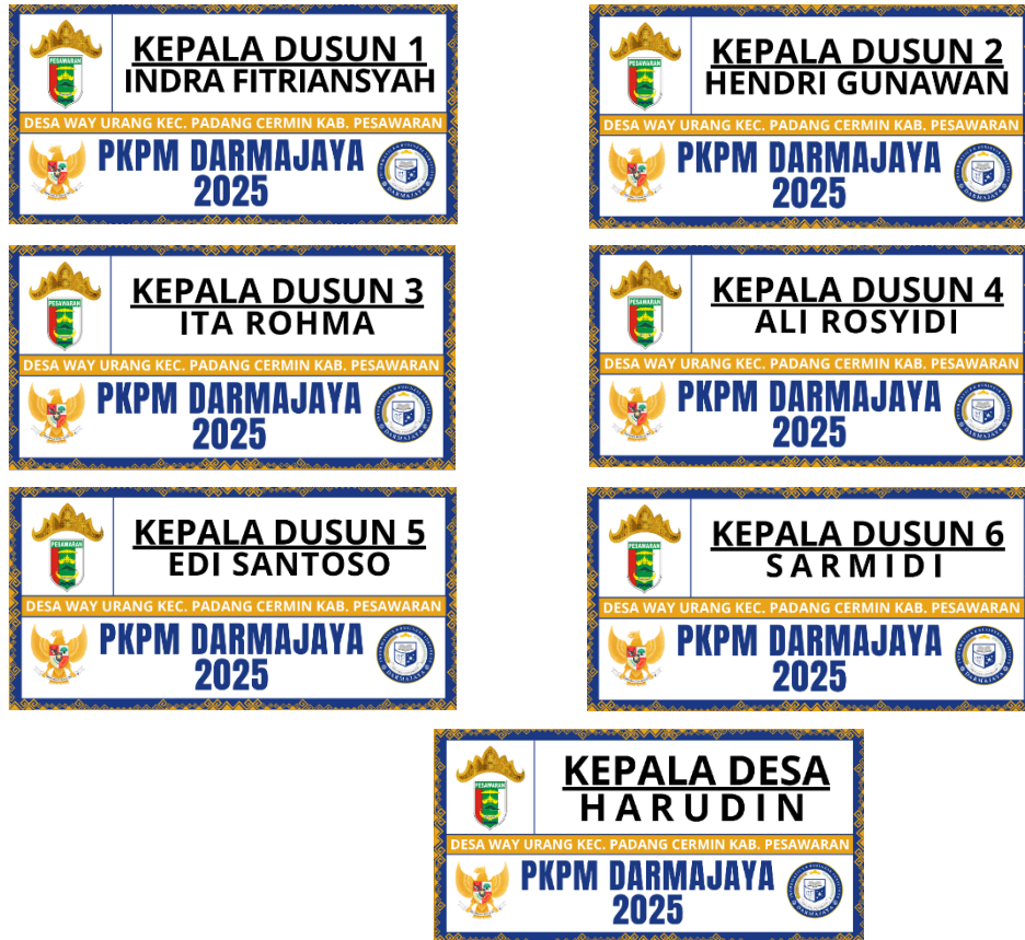
Gambar 6 Contoh Desain plang