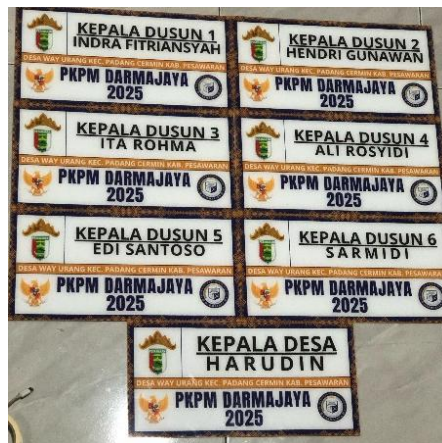
Gambar 7 Plang Kepala Dusun dan Kepala Desa