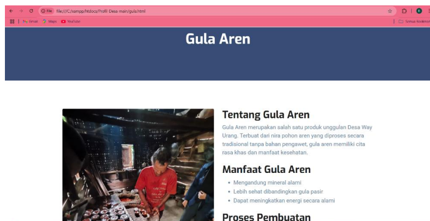
Gambar 4. Tampilan halaman umkm gula aren