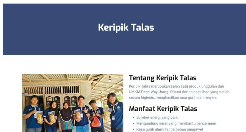
Gambar 3. Tampilan halaman umkm kripik talas