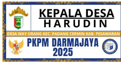
Gambar 6 Contoh Desain plang