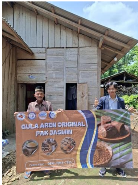
Gambar 3 Penyerahan Stiker Ke Pelaku UMKM

Pada gambar 2 merupakan desain banner yang sudah di buat untuk UMKM gula aren pak jasmin.