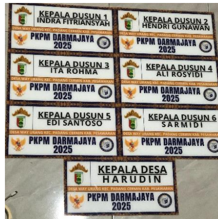
Gambar 7 Plang Kepala Dusun dan Kepala Desa

Pada Gambar 6 Dan 7 Hasil Desain Dan Hasil Cetak Plang Nama Kepala Dusun Dan Plang Nama Kepala Desa.