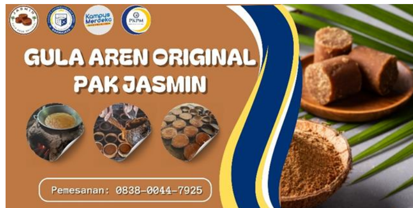
Gambar 2 Logo Gula Aren Pak Jasmin

dikenali, dipercaya, dan diminati oleh pasar yang lebih luas.