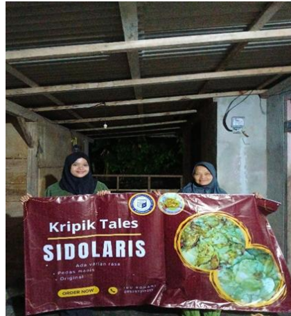
Gambar 2.3 Penyerahan Banner