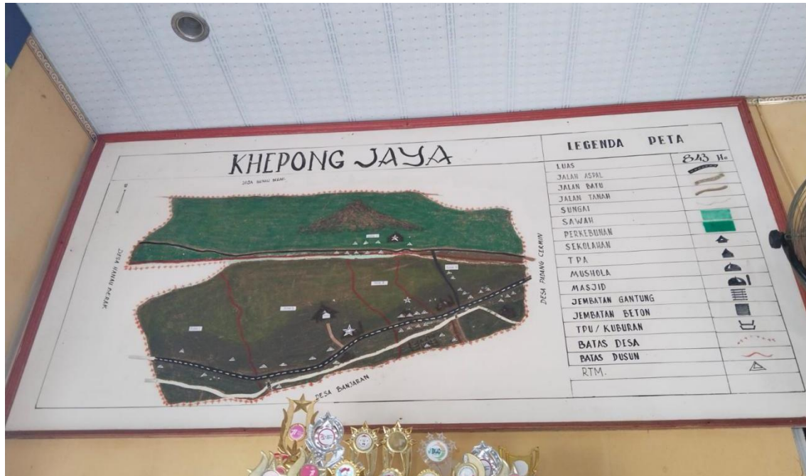
Gambar 1.1 Peta Desa Khepong jaya

Perkembangan Desa Khepong Jaya dapat dikatakan cukup aktif, ditandai dengan berbagai program pemberdayaan masyarakat yang dijalankan. Hal ini didukung oleh pemerintah desa, kelompok PKK, KWT, serta partisipasi aktif masyarakat dalam berbagai kegiatan sosial dan ekonomi yang turut berkontribusi dalam memajukan