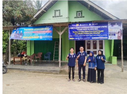
Kunjungan DPL ke Posko