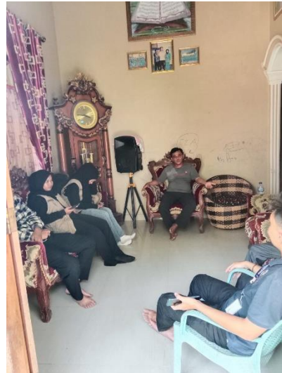
Kunjungan ke Dusun 3