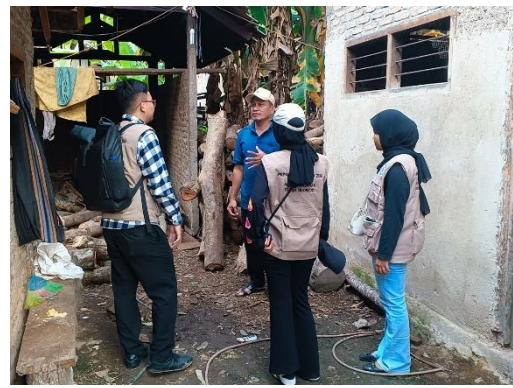
Kunjungan ke Pabrik Sabun