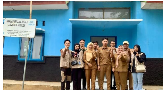
Kunjungan ke Puskesmas