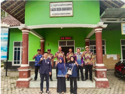
Kunjungan DPL ke Balai Desa