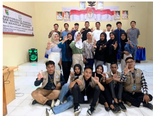
Foto Bersama Pemuda-Pemudi