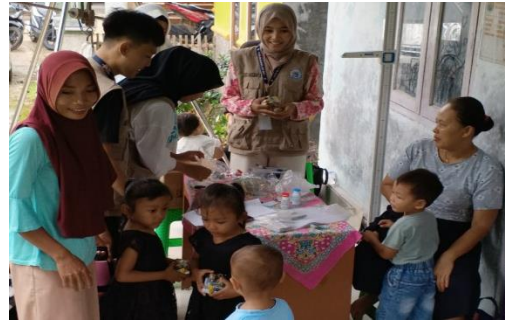
Penyuluhan Stunting di Posyandu