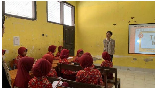
Memberikan Presentasi kepada Siswa-Siswi