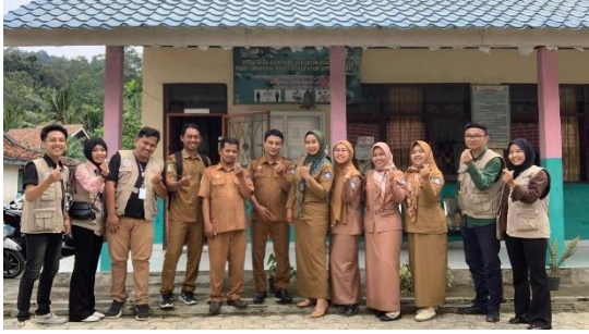
Foto bersama para Guru