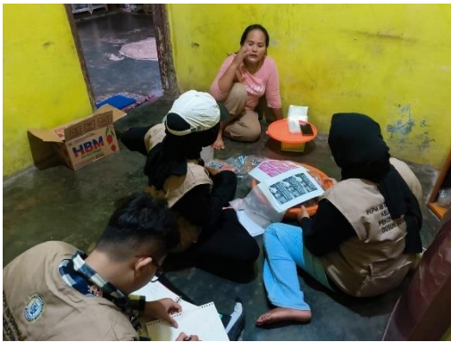
Kunjungan ke rumah pembuat Kripik Singkong