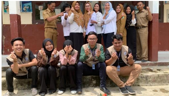
Foto bersama para Guru