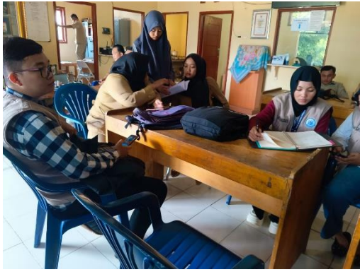
Memulai Pembuatan Web Desa di Balai Desa