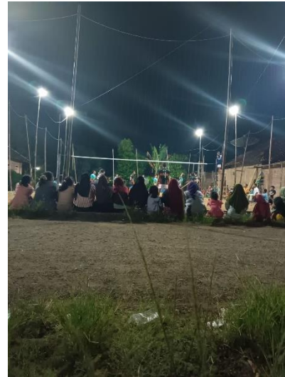
Menonton Pertandingan Voli antar Desa