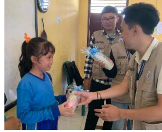
Hadiah bagi Siswa-Siswi yang telah menjawab pertanyaan