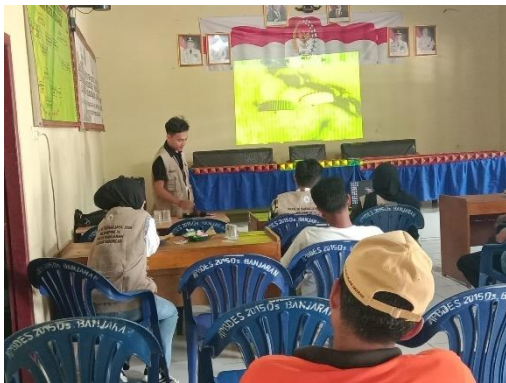
Penyuluhan Anti Narkoba di Balai Desa