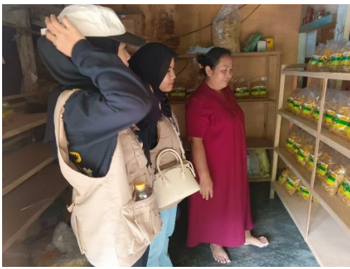
Kunjungan ke rumah pembuat Kripik Pisang