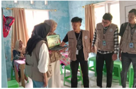
Penyuluhan Stunting di Posyandu