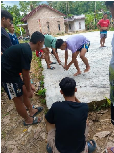
Gotong Royong Pemuda-Pemudi memasang Jaring Voli