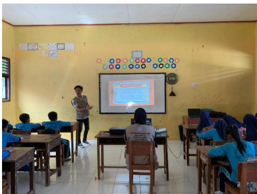
Memberikan Presentasi kepada Siswa-Siswi