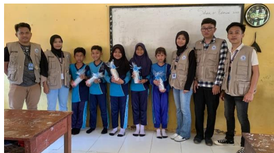
Foto Bersama para Siswa-Siswi yang sudah menjawab pertanyaan