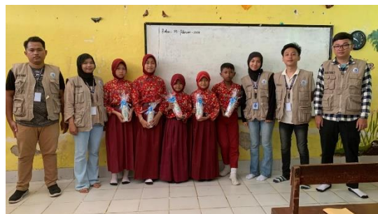
Foto Bersama para Siswa-Siswi yang sudah menjawab pertanyaan