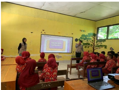
Memberikan Presentasi kepada Siswa-Siswi