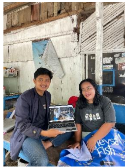
Gambar 2.1 Penyerahan Website kepada UMKM

Program ini bertujuan untuk memberikan solusi digital yang berkelanjutan bagi UMKM dalam mengembangkan usahanya secara online.