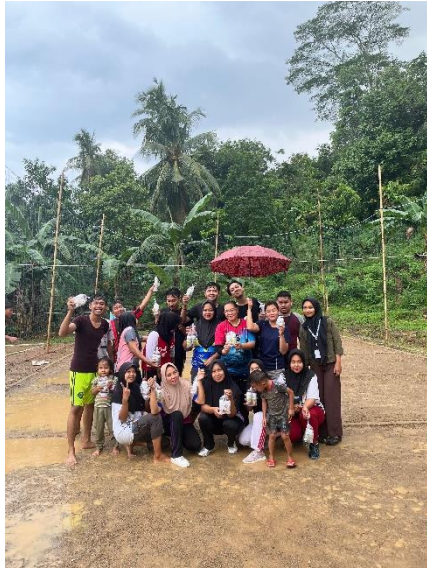
bermain voli Bersama ibu ibu