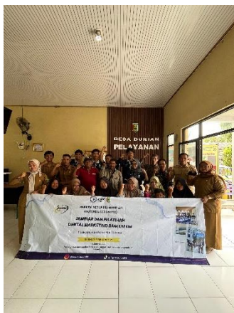
Foto dengan pelaku umkm