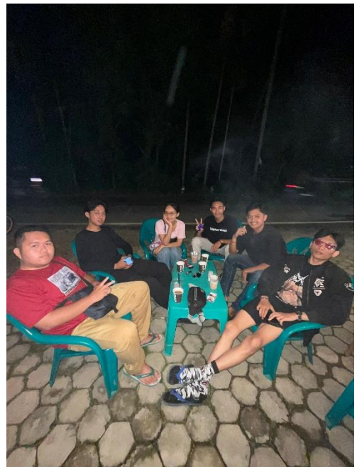
Silaturahmi dengan kelompok lain