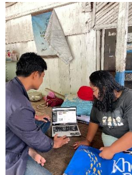
Gambar 2.2 Menunjukkan Presentasi Hasil Website