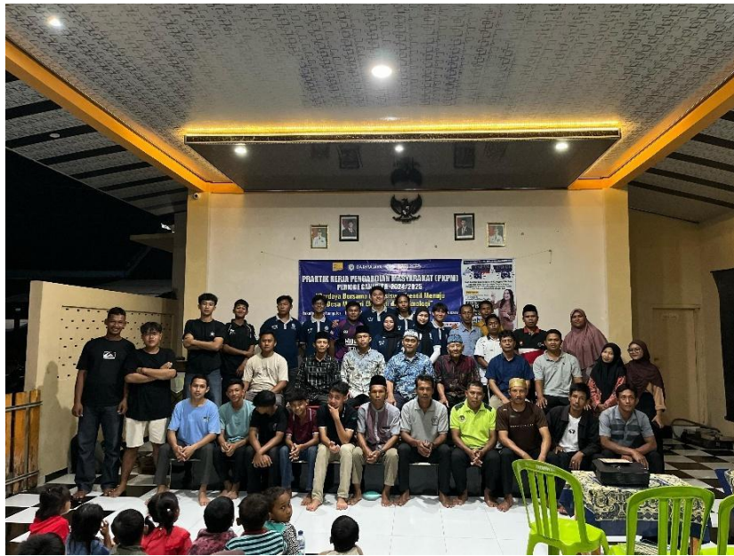
Foto Bersama Aparatur Desa dan Juga Pemuda Desa Trimulyo