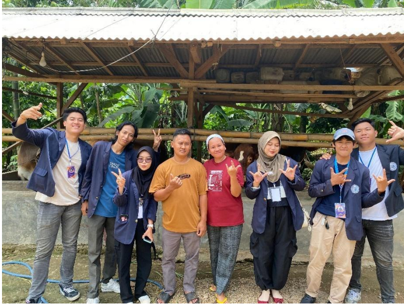
Foto Bersama Kepala Dusun II