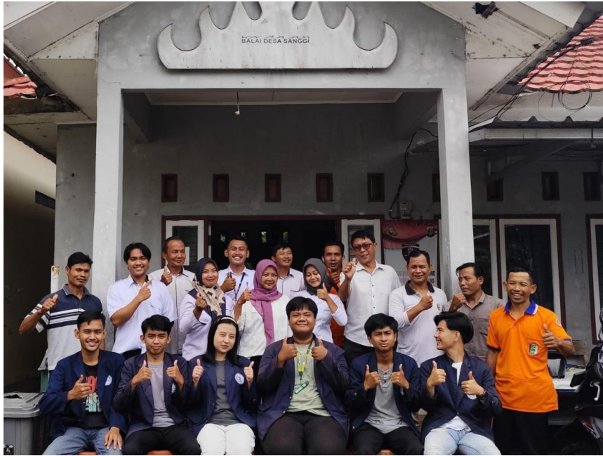
Poto Bersama Perangkat Desa