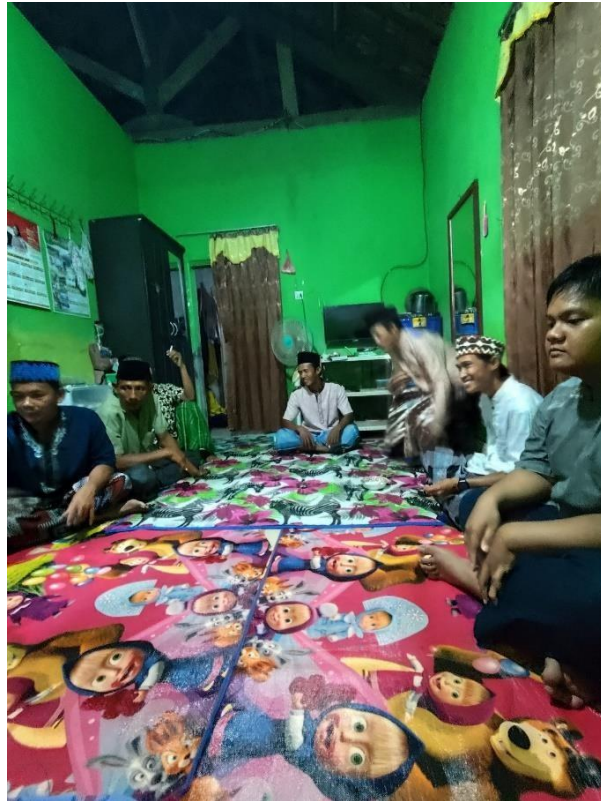
Pengajian jumat Rutin