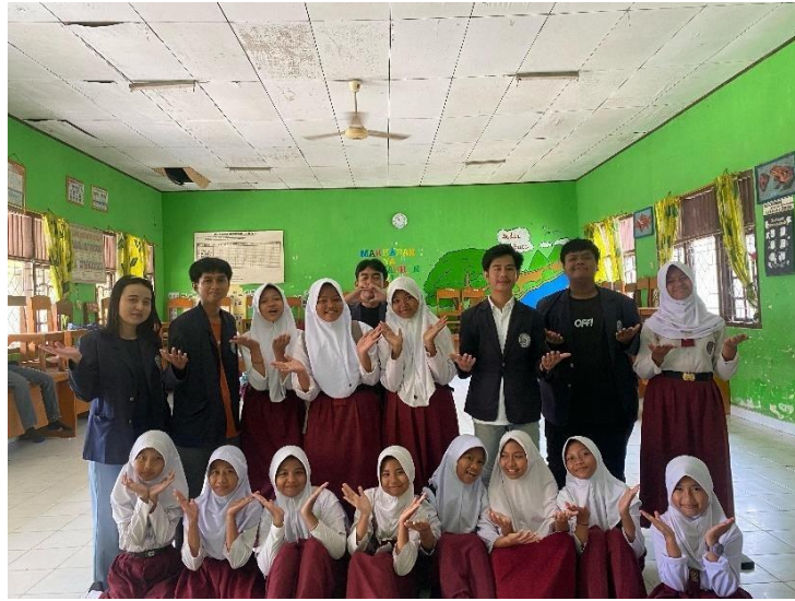
Foto Bersama anak SDN 14 Padang Cermin