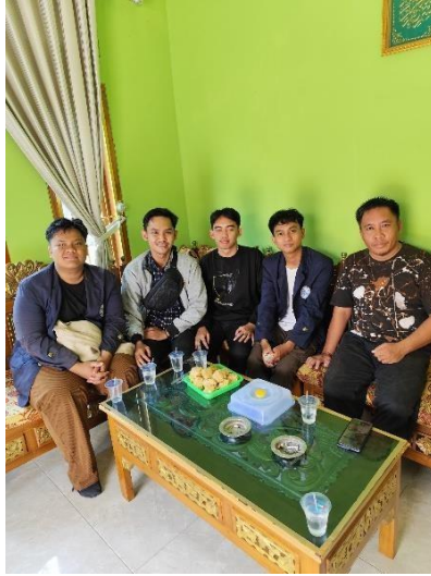
Kunjungan ke rumah Kepala Desa Sanggi