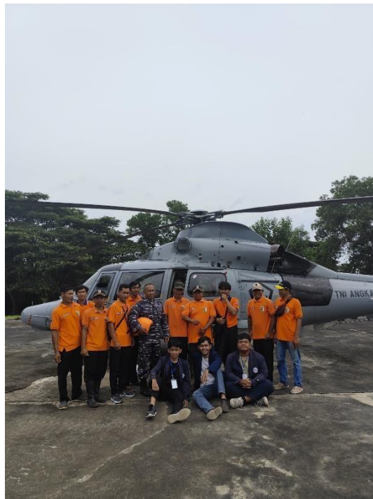
Poto Bersama TNI AL dan Perangkat Dusun saat penanaman Mangrove