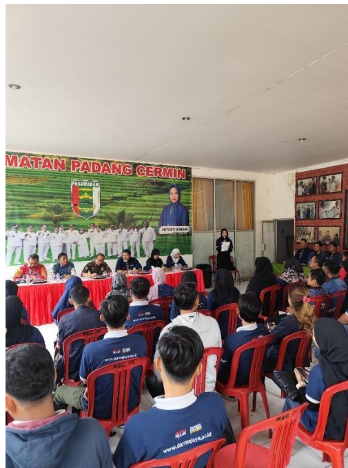
Pemberangkatan PKPM di Kecamatan Padang Cermin