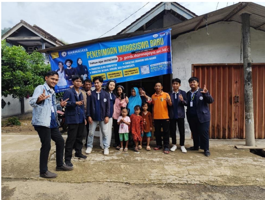
Poto Bersama ketua RT 02