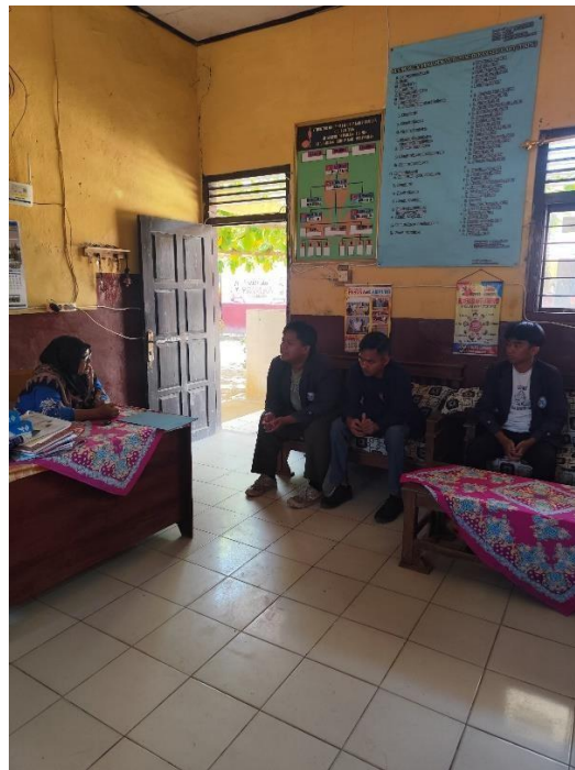
Pembahasan materi kepada Kepala Sekolah SDN 14 Padang Cermin