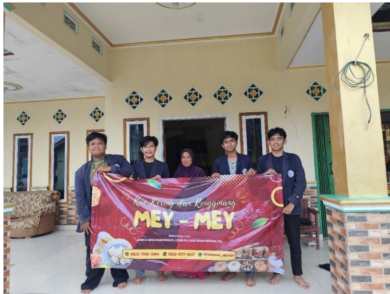
Penyerahan Baner ke UMKM