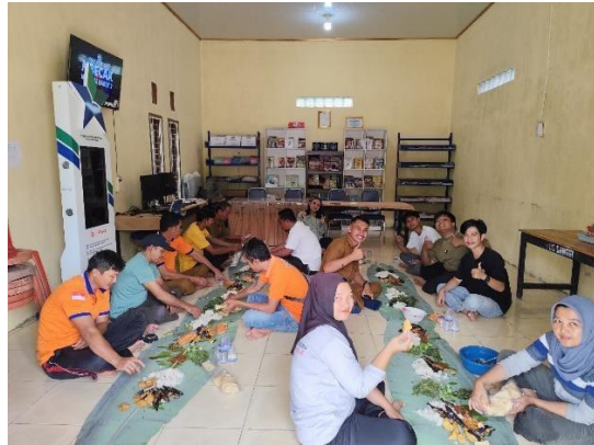
Makan Bersama perangkat desa