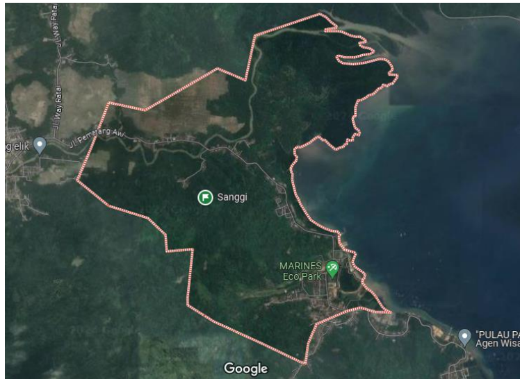
Gambar 1. 1 Citra Satelit Desa Sanggi