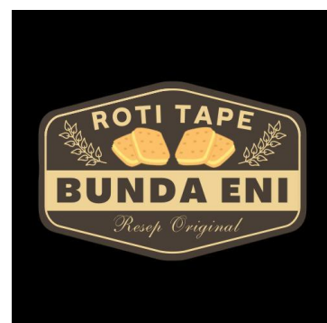
Gambar 2.3 Logo Roti Tape Bunda Eni Yang Baru