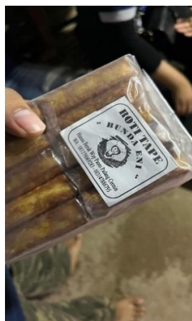
Gambar 2.2 Logo Roti Tape Bunda Eni Yang lama