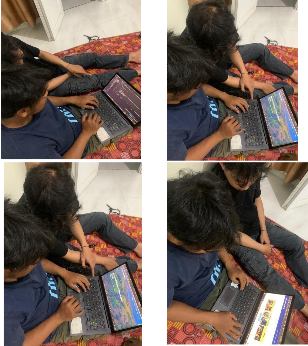
Gambar 2.3.4 Hasil dari Website Desa Hanau