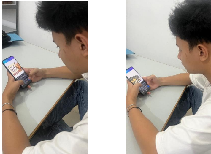
Gambar 2.3.2 Pembuatan Logo menggunakan aplikasi canva