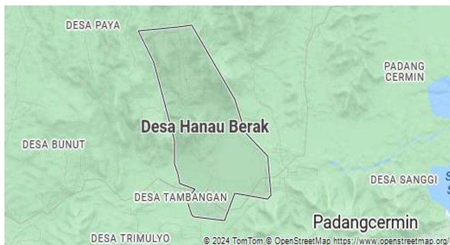
Gambar 1. 1 Peta Desa Hanau Berak

Desa Hanau Berak terletak di Kecamatan Padang Cermin, Kabupaten Pesawaran, yang merupakan lokasi dari UMKM Keripak Aneka Rasa RN yang menjadi objek penelitian ini. Peta ini menunjukkan lokasi Desa Hanau Berak dalam konteks geografis yang lebih luas, dapat dilihat pada gambar 1.1