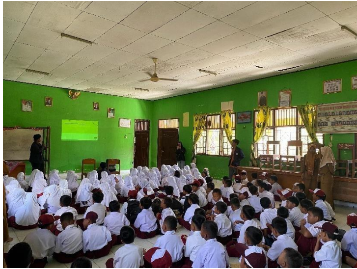
Gambar 2. 9 Sosialisasi di SDN 14 Padang Cermin