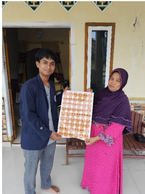
Gambar 2. 4 Penyerahan Stiker Logo Rengginang Mey-Mey