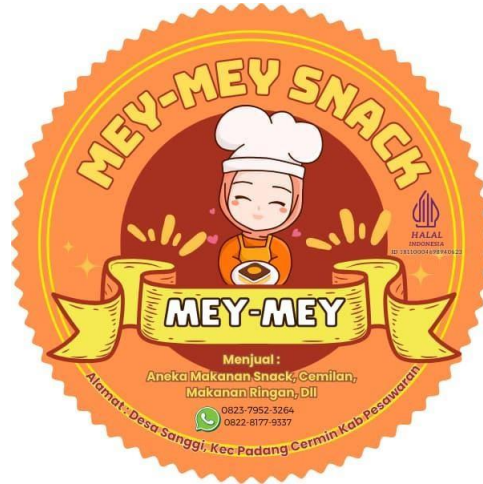
Gambar 2. 3 Hasil Dari Desain Logo Kue Kering Mey-Mey