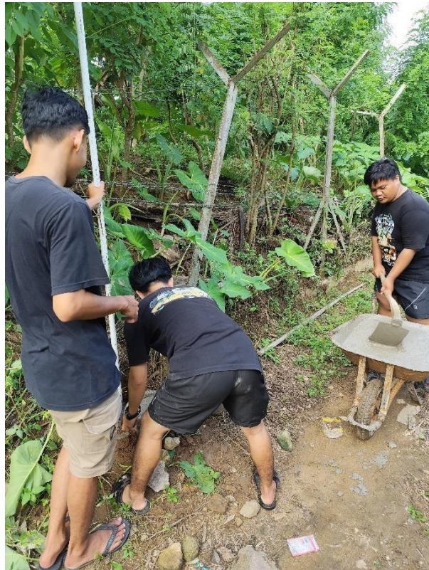
Gambar 2. 10 Pemasangan Lampu Jalan bertenaga surya