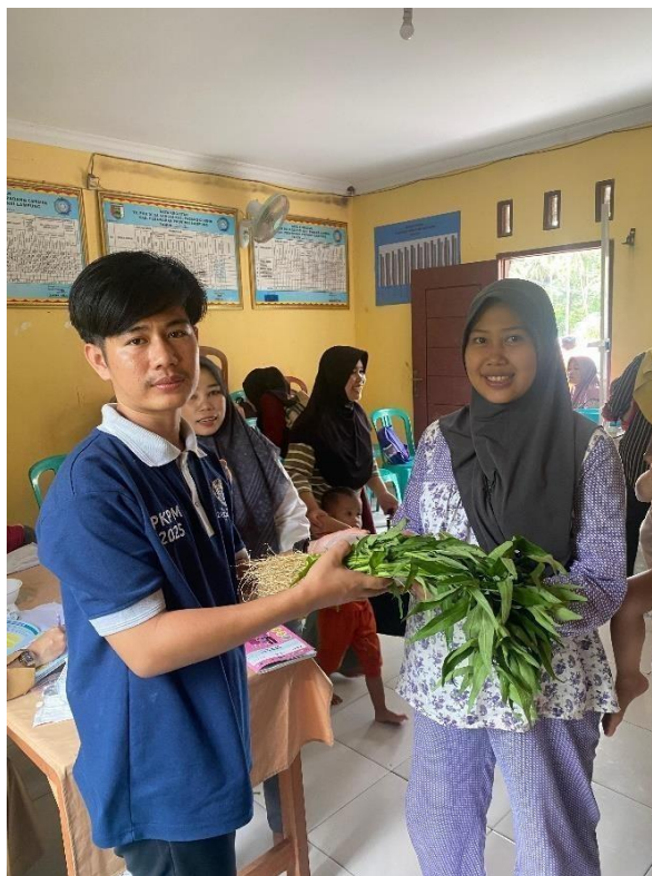
Gambar 2. 8 Posyandu Balita dan Lansia