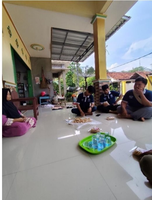
Gambar 2. 1 Diskusi mengenai Logo Rengginang &Kue Kering