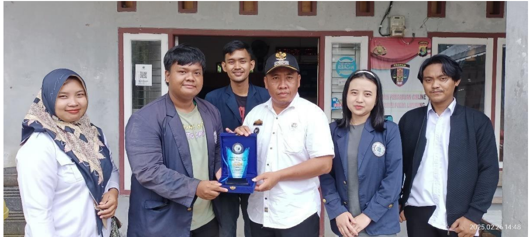
Gambar 2. 11 Penyerahan Plakat