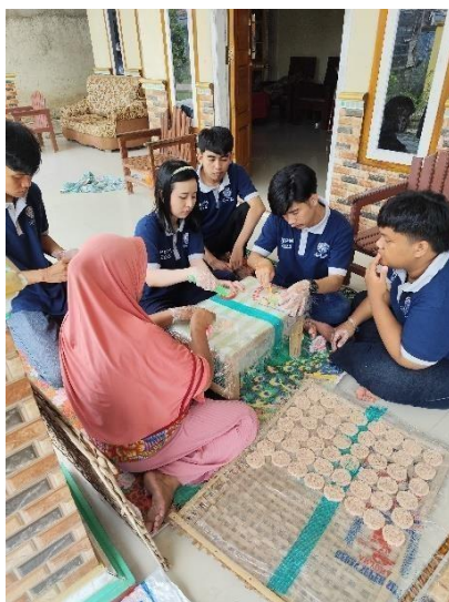
Gambar 2. 7 Proses Pembuatan Rengginang