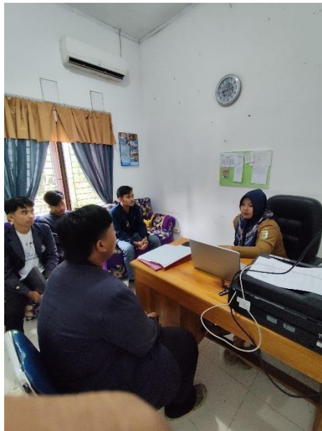
Gambar 2. 6 Diskusi Program Kerja