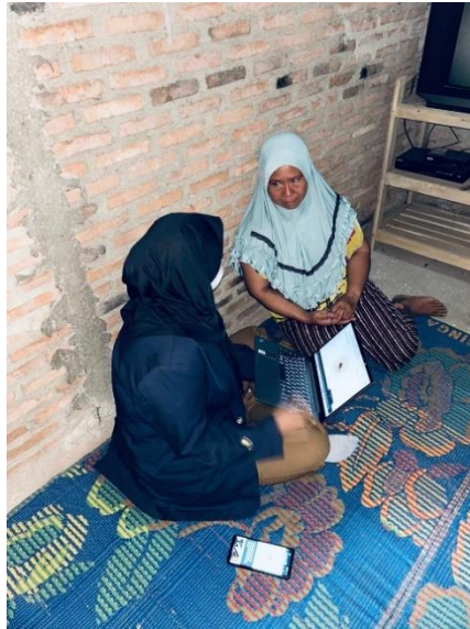
Gambar 2. 3 Penjelasan tentang cara menggunakan website

pemasaran yang baik. Dalam hal ini, penulis membantu Bu Mugiati dengan membuat Website dengan tujuan untuk mencatat dan menampilkan informasi terkait secara online, baik untuk penjualan maupun promosi, serta memberikan pelatihan mengenai pengelolaan konten dan desain dengan menggunakan platform berbasis internet.