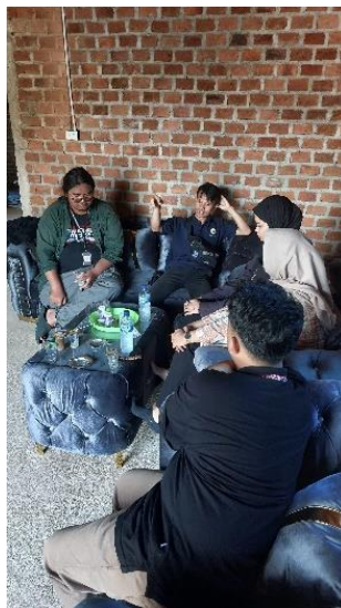
Gambar 2. 1 Konsultasi program kerja dengan aparatur desa

Berdasarkan perencanaan program kerja PKPM yang telah dibuat dan dilaksanakan, berikut penulis uraikan hasil dari program kerja & dokumentasi dari kegiatan tersebut. Adapun hasil kegiatan dan dokumentasi sebagai berikut :