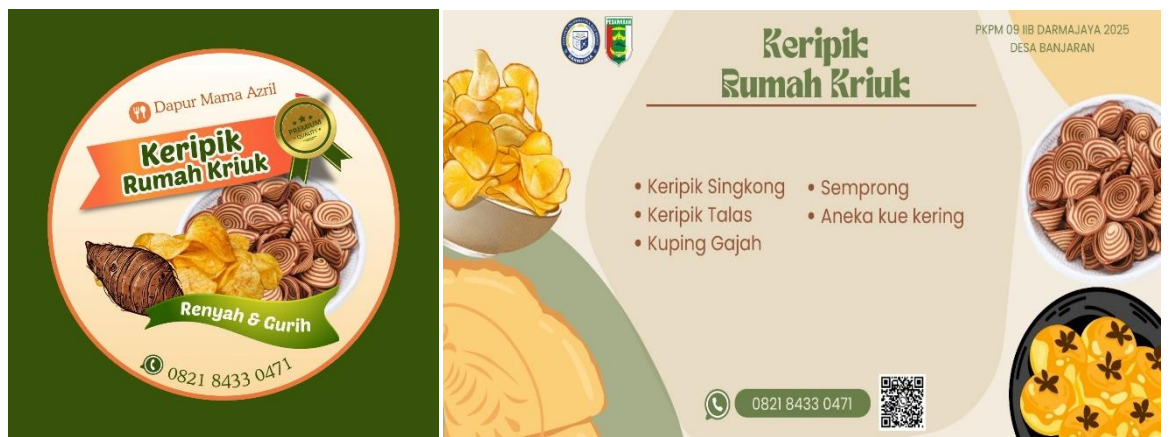
Gambar 2.3.1 Tampilan Logo UMKM

Dalam dunia usaha, logo dan banner memiliki peran penting sebagai identitas visual yang mencerminkan karakter dan nilai sebuah bisnis. Logo dan banner yang menarik dan professional dapat meningkatkan daya tarik serta kepercayaan pelanggan terhadap usaha yang dijalankan. Dari hasil pembuatan banner untuk pelaku UMKM Keripik Rumah Kriuk sudah dapat di pakai sebagai branding. Berikut tampilan logo dan banner yang sudah dibuat untuk pelaku UMKM.