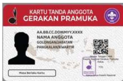
Gambar 2.2 Design KTA Pramuka

Memfasilitasi pembuatan dan distribusi KTA secara lebih sistematis agar setiap anggota memiliki identitas resmi yang valid.