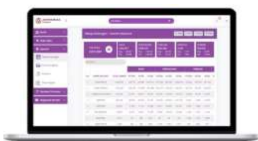
Gambar 2.1 Pengelolaan Data Berdasarkan Golongan

Mengembangkan sistem pencatatan dan verifikasi anggota secara digital untuk meningkatkan efisiensi dalam pengelolaan keanggotaan.