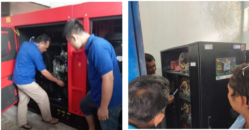
Gambar 4.3 Perawatan Rutin Peralatan