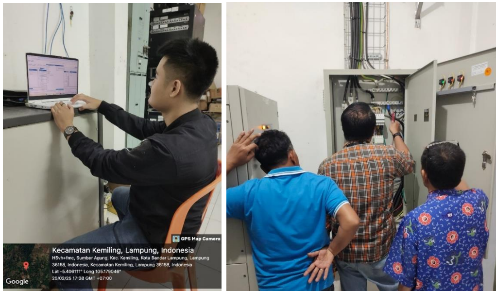
Gambar 4.2 Mengoperasikan dan Memelihara Peralatan