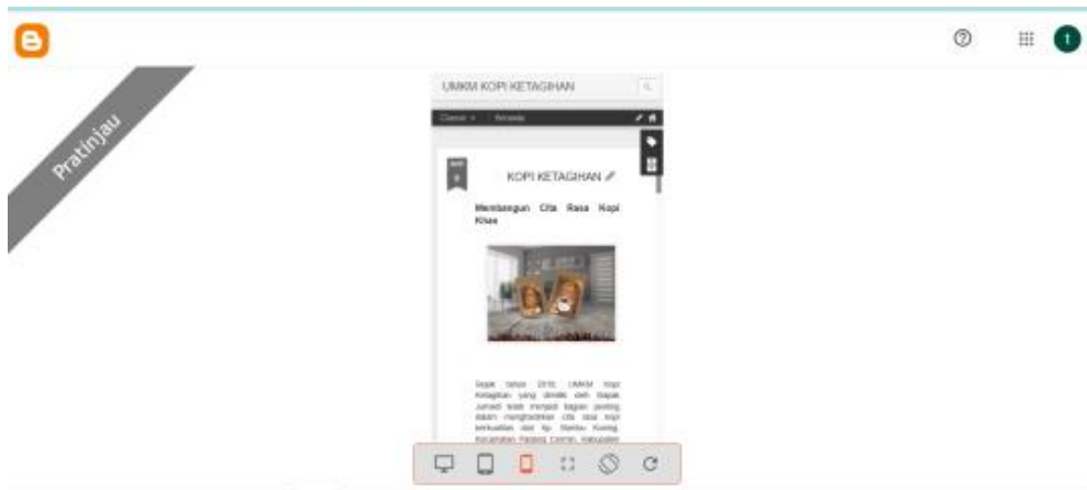
Gambar 2.1 Blog