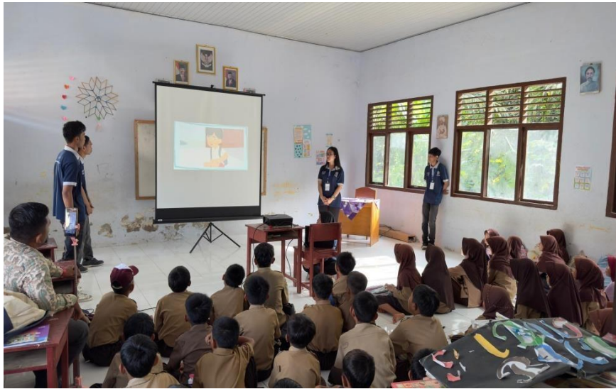
Gambar 2.3 memberikan sosialisasi kepada siswa SDN 5 Padang Cermin