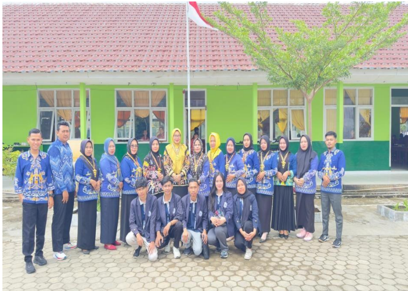
Gambar 2.2 Foto bersama dengan staff guru SDN 1 Padang Cermin