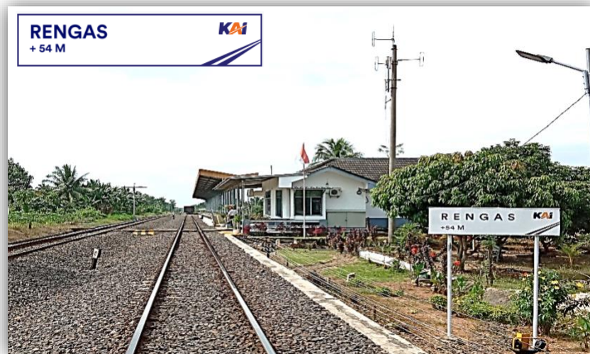
2.4.1. Gambar Upt Stasiun Rengas