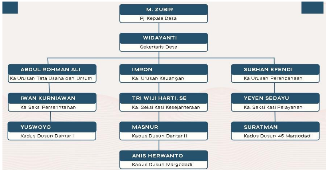
Gambar 2.2 Struktur Organisasi Pemerintah Desa Dantar