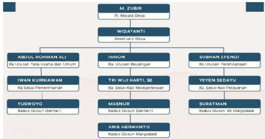
Gambar 1.2 Diagram Struktur Dalam Pemerintahan Desa Dantar

a. Susunan organisasi pemerintah desa Dantar