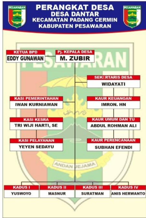
Gambar 1.2 Struktur Perangkat Desa Desa Dantar

Visi Desa Dantar yaitu mewujudkan Desa Dantar yang mandiri, Sejahtera, dan Berdaya saing berbasis Pertanian dan kearifan lokal. Sedangkan misinya yaitu Meningkatkan perekonomian masyarakat melalui pengembangan pertanian, wisata, dan UMKM, serta memperbaiki infrastruktur desa untuk mendukung akses layanan kesehatan, pendidikan, dan komunikasi. Meningkatkan kesejahteraan sosial dengan pelatihan keterampilan, pemberdayaan pemuda dan perempuan, serta menjaga kebersihan lingkungan. Mewujudkan tata kelola pemerintahan yang transparan dan partisipatif serta melestarikan budaya dan kearifan lokal sebagai identitas Desa Dantar.