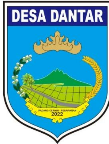
Gambar 1.3 Logo Desa Dantar