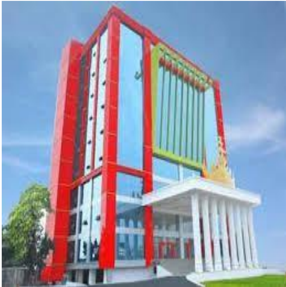
Gambar 2.4 Kantor Bagian Hukum Setda Kota Bandar Lampung

Berikut adalah Kantor Bagian Hukum Setda Kota Bandar Lampung :