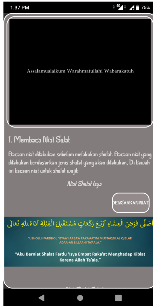
Gambar 4.2 Tampilan Halaman Tata Cara Sholat