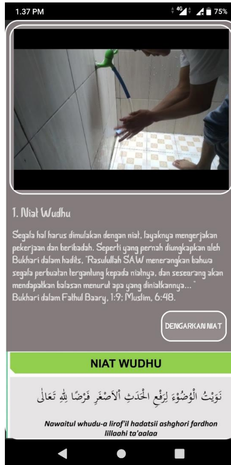
Gambar 4.3 Tampilan Halaman Wudhu