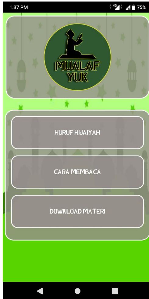
Gambar 4.5 Tampilan Halaman Belajar Mengaji