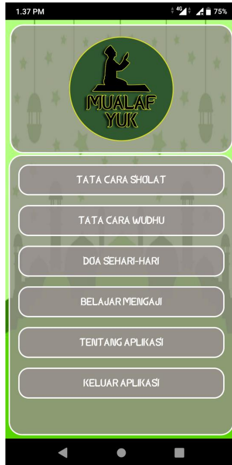
Gambar 4.1 Tampilan Halaman Utama