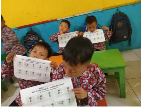
Lampiran 1 Foto anak anak yang menunjukan kuisisioner