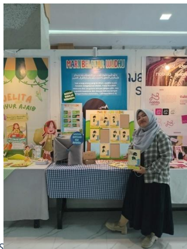
Lampiran 6 Foto Pameran