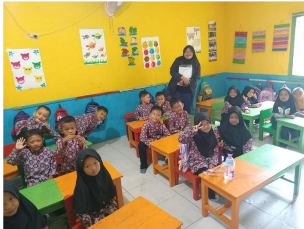
Lampiran 2 Foto Bersama anak anak PAUD Nur Hidayah