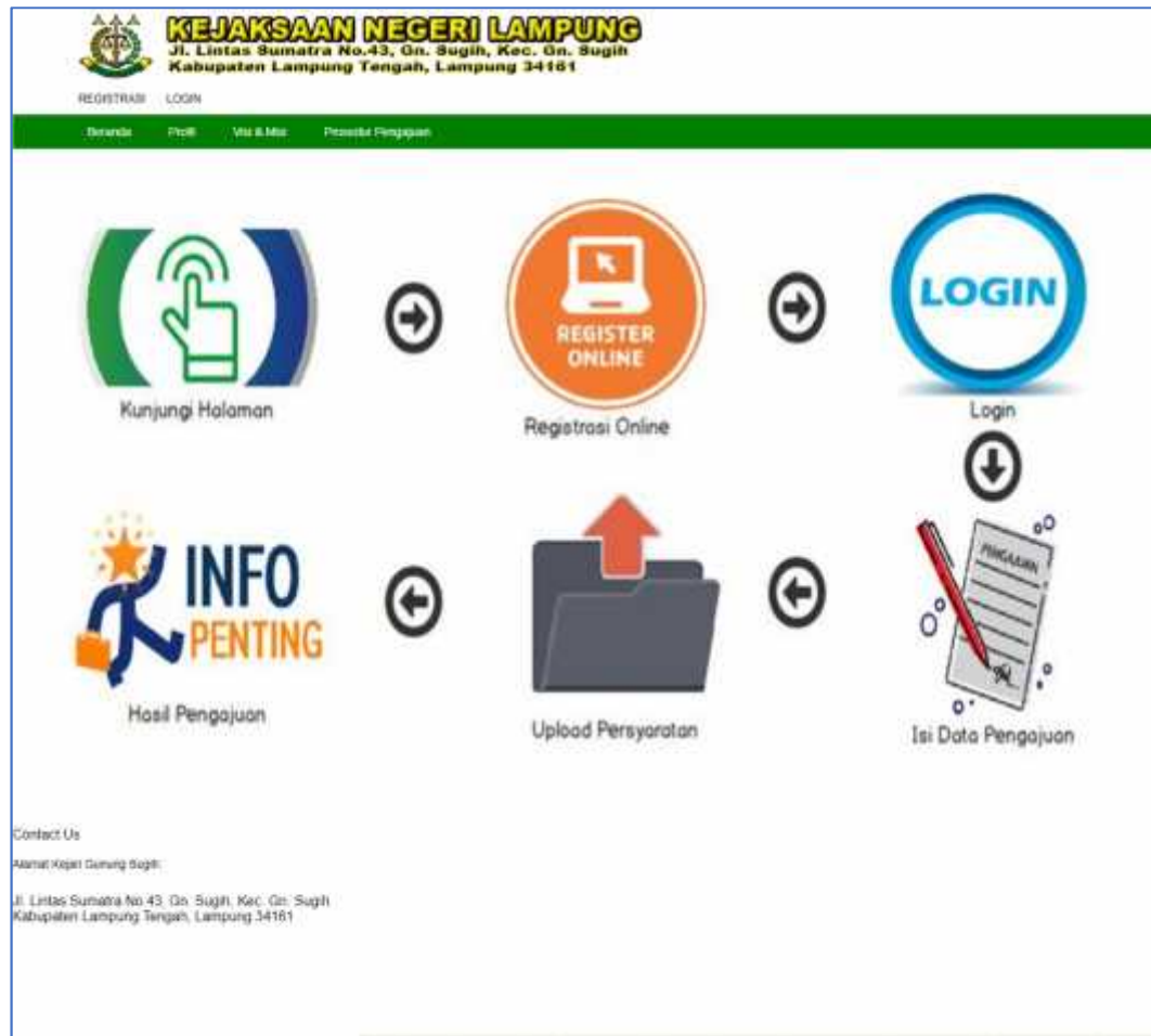
Gambar 4.7. Implementasi Antar Muka Prosedur Pengajuan