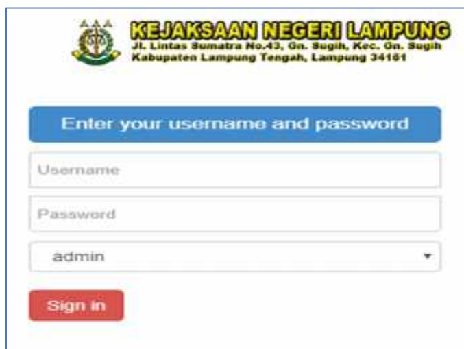
Gambar 4.1. Implementasi Antar Muka Login Admin

Implementasi antar muka login admin dapat dilihat pada gambar 4.1 dibawah ini: