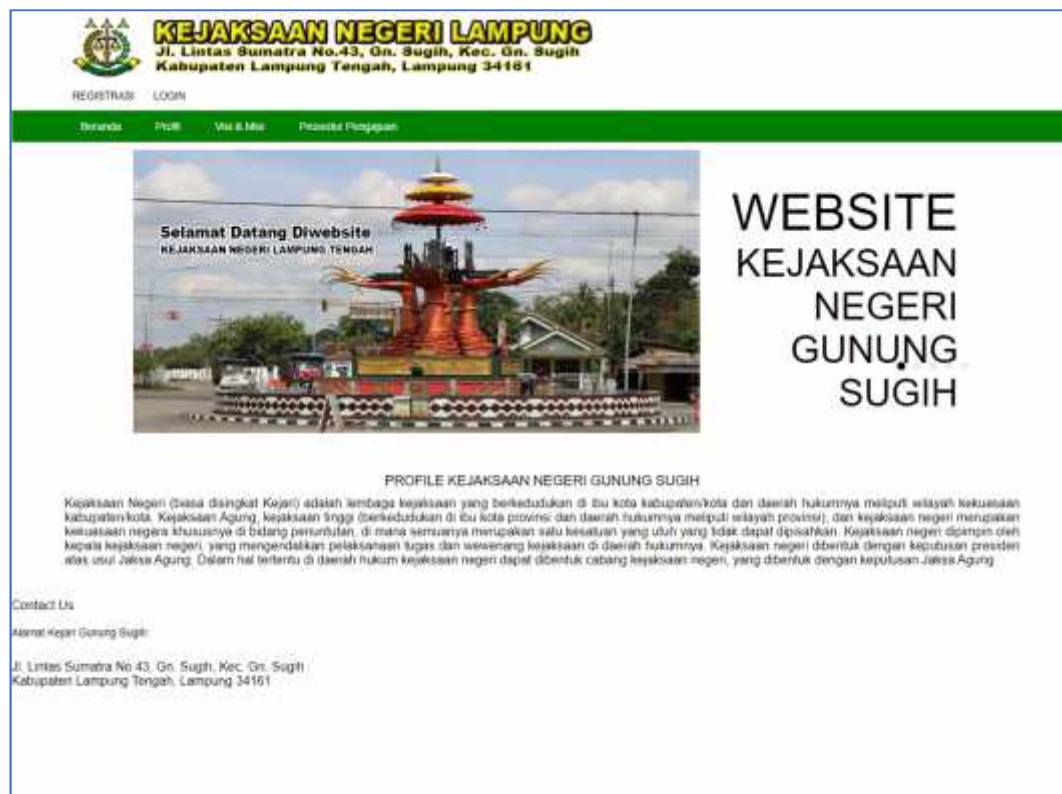
Gambar 4.5. Impelementasi Antar Muka Profil Perusahaan