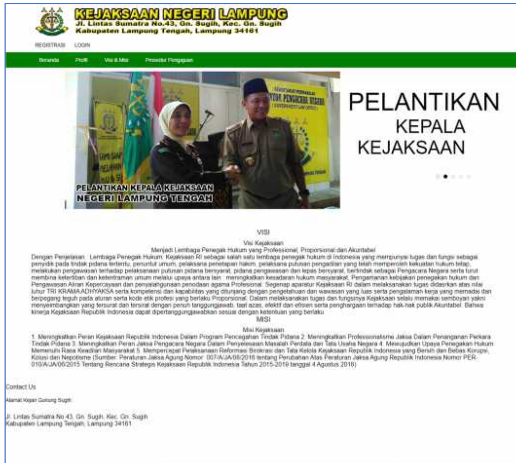
Gambar 4.6. Implementasi Antar Mukan Visi dan Misi