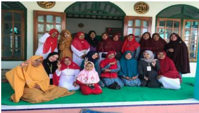
Foto Kegiatan Pengajian Ibu-ibu Al-Hidayah Desa Bumisari