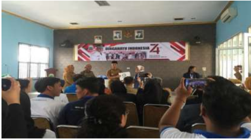
Foto Penyerahan Mahasiswa/i PKPM di Kantor Kecamatan Natar