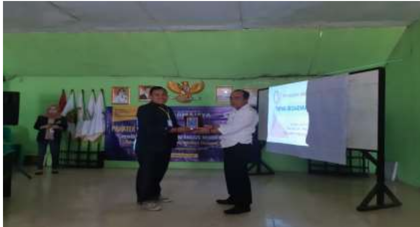
Foto Penyerahan cenderamata kepada Kepala Desa diacara Pelepasan Mahasiswa PKPM di Balai Desa Bumisari