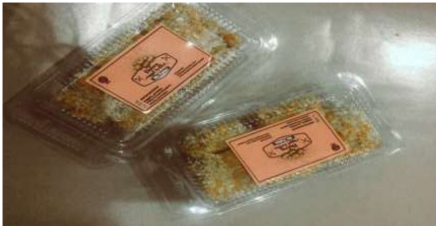
Gambar Produk Nugget Kedelai yang sudah dikemas dan diberi Merk Kemasan