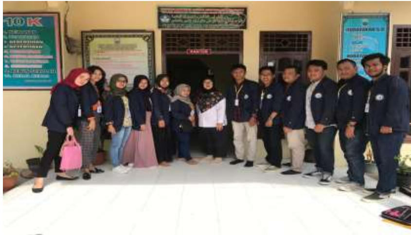
Foto Bersama dengan pihak Sekolah SDS Swadhipa Natar