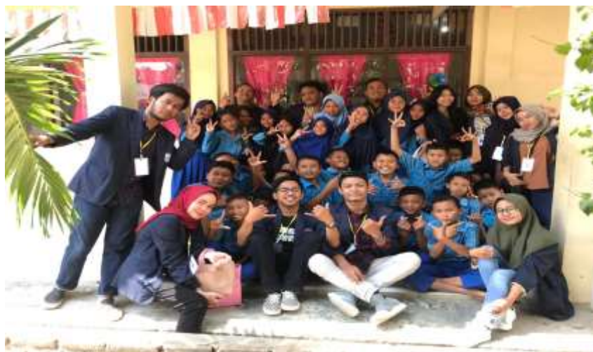
Foto Bersama Murid-murid SDS Swadhipa Setelah Mengadakan Sosialisasi