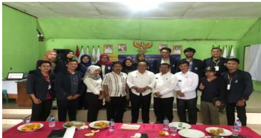
Foto Bersama Pelepasan Mahasiswa/i PKPM di Balai Desa Bumisari