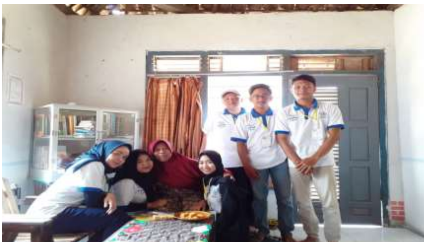
Foto Bersama Pemilik UKM “Susu Kedelai” yang menginovasikan menjadi “Nugget Kedelai