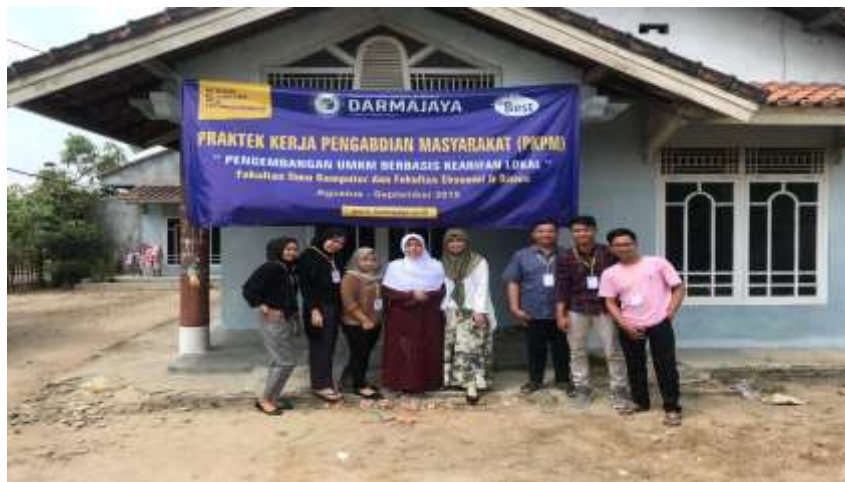
Foto Kunjungan DPL ke Posko PKPM di Desa Bumisari