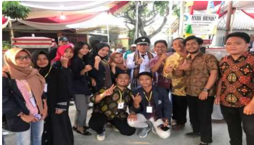
Foto Menghadiri Pelantikan Kades Bumisari Periode Ketiga