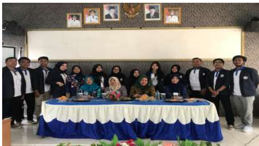
Foto Bersama Pelepasan Mahasiswa/i PKPM di Kantor Kecamatan Natar