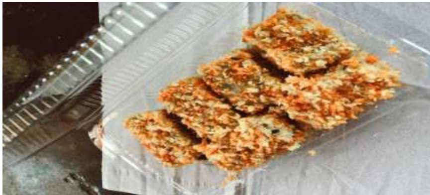
Tampilan Produk Nugget Kedelai yang masih mentah