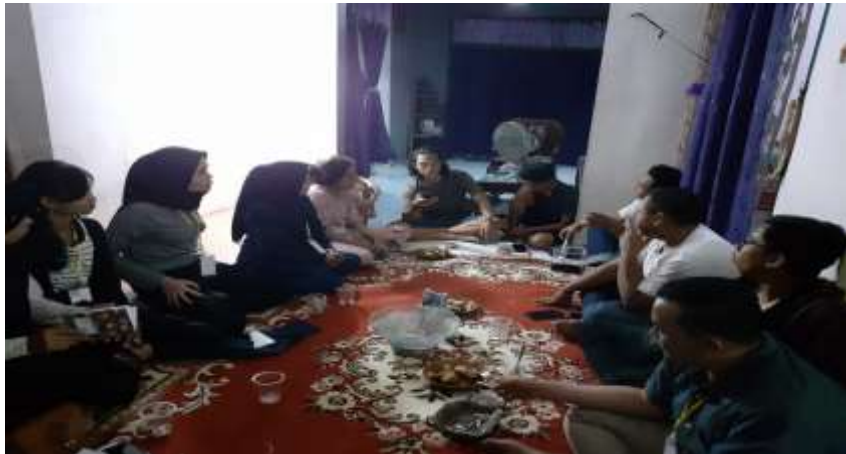
Foto Pengenalan Karang Taruna Desa Bumisari