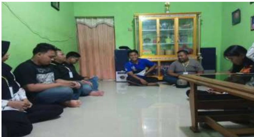
Foto Pengenalan mahasiswa PKPM kepada Kepala Dusun