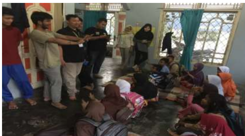
Foto Mengadakan Kegiatan Les Private bersama Anak-anak Desa Bumisari