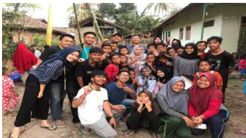
Foto Memperingati Acara Perlombaan 17 Agustus