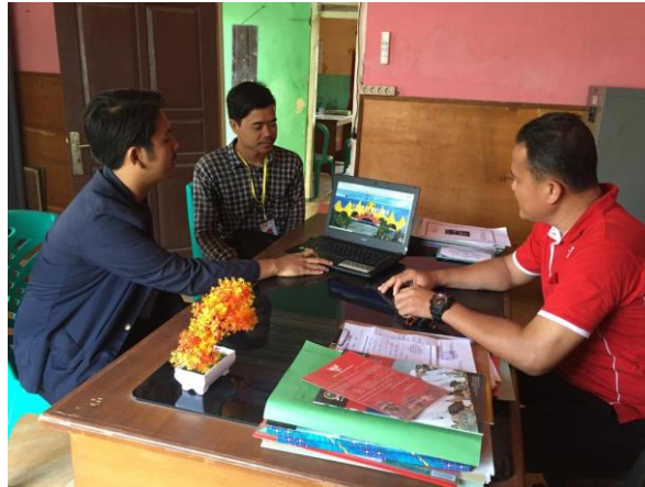
Gambar 10. Penjelasan Website Desa Bumi Agung