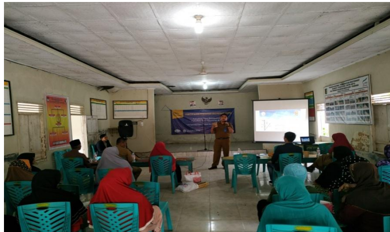
Gambar. 1.3 Penjelasan Mengenai Pemasaran

Kegiatan seminar ini bekerjasama dengan Badan Ekonomi Kreatif (BEKRAF) pemda Pesawaran untuk memberikan materi tentang perubahan pola pikir anyaman bambu dan sekaligus memberikan materi tentang pemasaran anyaman bambu. Salah satunya adalah pada tingkat pemasaran yang masih rendah sehingga anyaman bambu belum diketahui khalayak ramai. Untuk itu perlu dilakukan peningkatan dalam pemasaran produk yaitu dengan memanfaatkan teknologi saat ini yaitu dengan cara online dimana cara ini cukup ampuh untuk memasarkan sebuah produk.