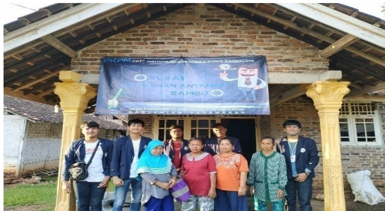
Gambar. 1.9 Foto Bersama Komunitas Anyaman Bambu

Pembentukan komunitas anyaman bambu yang pertama adalah pengumpulan masyarakat di salah satu rumah penganyam. Komunitas ini dibimbing oleh Badan Ekonomui Kreatif (BEKRAF) pemda Pesawaran. Komunitas anyaman bambu ini bertujuan untuk menjaga kelestarian anyaman bambu desa Purworejo dan mempermudah pengrajin anyaman bambu untuk membuat inovasi lainnya.