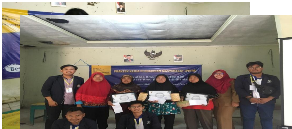
Gambar1.7 Penilaian Lomba Anyaman

Rencana kegiatan ini yaitu lomba anyaman bambu yang akan diselenggarakan di balai desa Purworejo dan di ikuti oleh pengrajin anyaman bambu yang sebelumnya telah di data pada saat pelatihan bertujuan untuk mengimplementasi dari hasil pelatihan yang telah dilaksanakan.