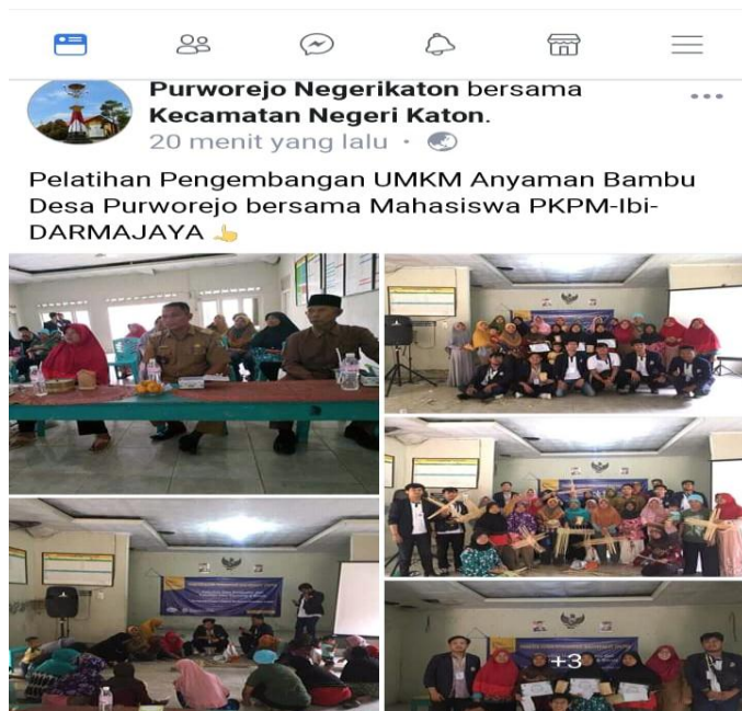
Gambar Media Pemasaran Melalui Facebook