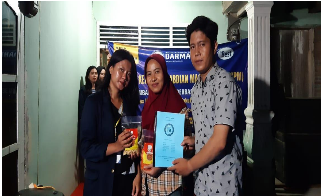
Gambar 4.5 Peningkatan Kualitas Sumberdaya Manusia Melalui Pelatihan