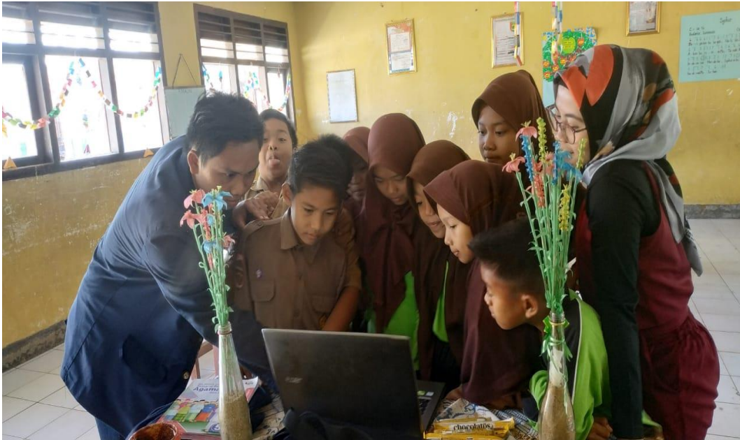
Gambar 4.6 Pelatihan dan Pengenalan Teknologi Komputer dan Internet