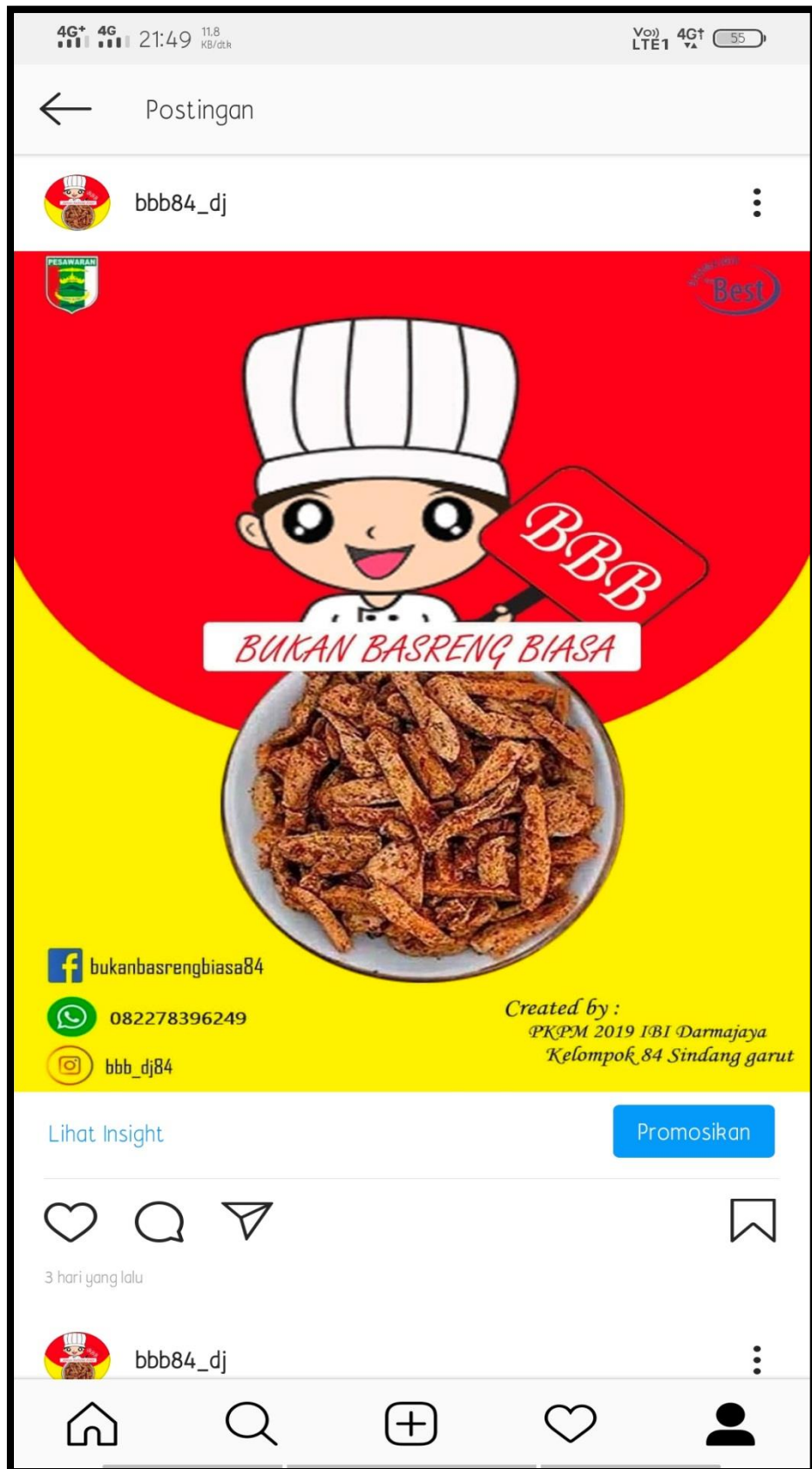
Gambar 4.2 Media Marketing UKM Basreng Melalui Instagram.