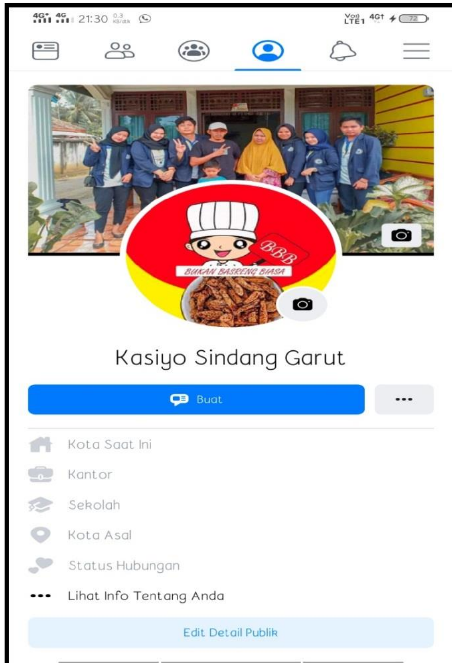
Gambar 4.3 Media Marketing Ukm Bukan Basreng Biasa Melalui Facebook