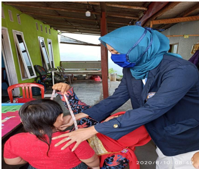
Gambar 3. Kegiatan sosialisasi posyandu

Dimasa pandemi covid 19 banyak masyarakat yang kurang sadar pentingnya mematuhi protokol kesehatan maka dari itu saya melakukan sosialisasi ke warga Desa Budidaya untuk mengikuti protokol kesehatan sekaligus membagikan masker kepada ibu-ibu yang datang ke posyandu dan mengajarkan mencuci tangan dengan benar.