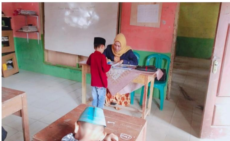
Gambar 2. Tentang pembelajaran anak anak MI Darul Ulum

Salah satu program kami yaitu mencerdaskan anak bangsa, belajar dengan tetap menjaga jarak guna mengingat situasi dimasa pandemi. Mengajarkan anak-anak mencuci tangan yang baik dan mengajarkan membaca serta menulis.