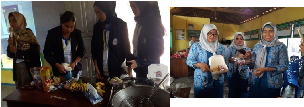
Gambar 3 kegiatan seminar membidik peluang usaha melalui entrepreneurship di balai desa kuta dalam bersama ibu-ibu PKK dan karang Taruna dengan pemateri Bapak Yoeyong Rahsel S.Pd., MM