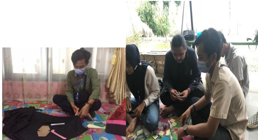
Gambar 2.2 Proses pembuatan Masker dan Handsenitizer

Sedangkan handsanitizer adalah cairan atau gel yang umumnya digunakan untuk mengurangi patogen pada tangan. Pemakaian penyanitasi tangan berbasis alkohol lebih disukai daripada mencuci tangan menggunakan sabun dan air pada berbagai situasi di tempat pelayanan kesehatan.