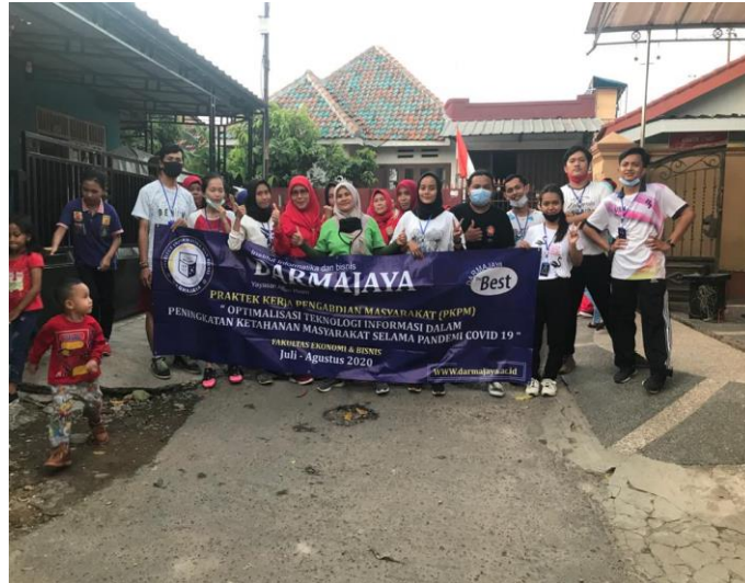
Gambar 2.6 Senam Bersama Warga RT.06