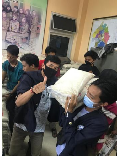
Gambar 2.4 Pembagian BNT

bantuan yang diangkut. Kegiatan tersebut juga mengajak mahasiswa terjun langsung kerumah warga untuk memberikan bantuan non tunai berupa pangan pokok atau beras.