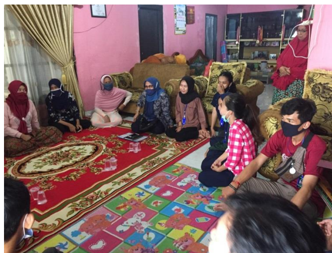
Gambar 2.8 Sosialisasi Strategi Pemasaran & Inovasi Usaha Bersama PKK

Strategi yang kami fokuskan pada ibu-ibu PKK Kaliawi antara lain mereka harus menentukan produk apa yang menjadi andalannya dan bagaimana cara mengembangkan produk andalannya tersebut. Misalnya dengan menambah varian rasa, varian bentuk dan kemasannya yang menarik.