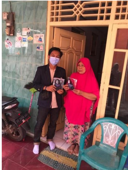
Gambar 2.5 Pembagian Masker dan Handsanitizer