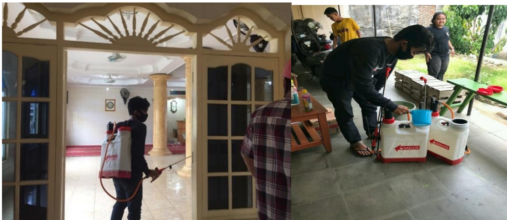
Gambar 2.3 Penyemprotan Desinfektan

sanitizer gratis ini dibagikan ke setiap rumah warga. Pada kegiatan ini kita juga sosialisasikan pentingnya memakai masker bila keluar rumah dan rajin mencuci tangan sesuai anjuran Pemerintah Kota Bandar Lampung. Dengan adanya pemberian masker dan hand sanitizer gratis ini, masyarakat di Kelurahan Kaliawi RT.06 bisa lebih menyadari pentingnya melindungi diri dari bahaya yang mengintai dan tidak terlihat dengan kasat mata dan untuk pencegahan covid-19, kami menghimbau masyarakat untuk menerapkan Perilaku Hidup Bersih dan Sehat (PHBS) dan selalu memakai alat pelindung diri setiap menjalankan kegiatan yang dianggap penting, serta menjauhi kerumunan atau bila perlu diam dirumah saja.