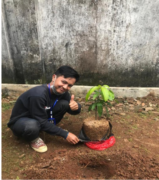
Gambar 2.7 melakukan Penghijauan di RT.06