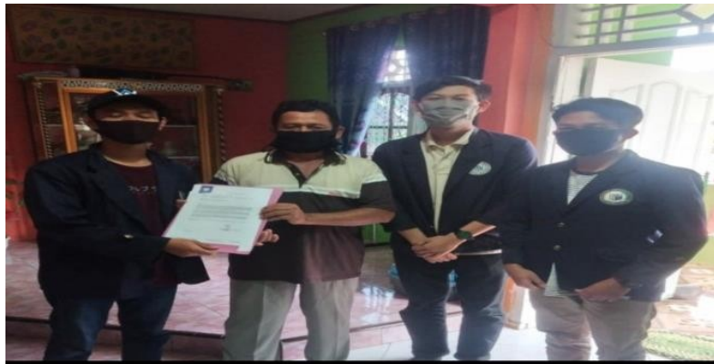
Gambar 2.1 Penyerahan surat izin dan penyuluhan mengenai wabah covid-19

Menedukasi tingkat pemahaman masyarakat Desa Sumber Rejo Sejahtera Kecamatan Kemiling Bandar Lampung tentang bahaya dan bagaimana cara pencegahan penyebaran Covid-19 melalui media social. Program kerja yang saya lakukan yakni menedukasi masyarakat Desa Sumberrejo Kecamatan Kemiling Bandar Lampung mengenai wabah Covid-19, Sehingga masyarakat lebih waspada mengenai wabah virus ini dan lebih menjaga kebersihan, tetap tinggal dirumah, menggunakan masker, tetap jaga jarak fisik, cuci tangan menggunakan sabun, dan tetap mengikuti protocol kesehatan sesuai dengan anjuran pemerintah. Dengan adanya penyuluhan mengenai masalah wabah covid-19.