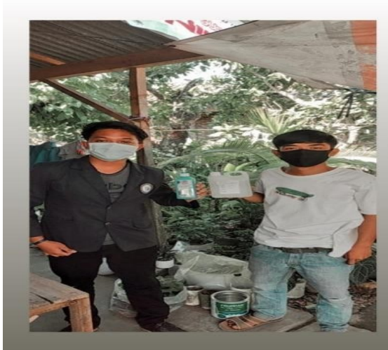
Gambar Pembagian Handsanitaizer