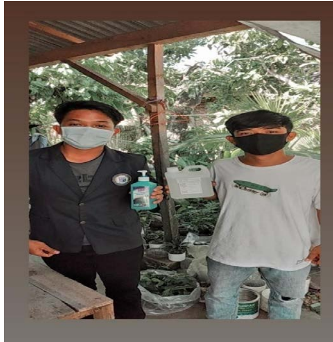
Gambar 2.6 Pembagian Handsanitizer

Melakukan bersih-bersih didesa Sumber Rejo Sejahtera Kecamatan Kemiling Bandar Lampung upaya pencegahan Covid-19 Melakukan kegiatan bersih-bersih sebagai salah satu bentuk aksi kepedulian dan solidaritas terhadap sesama, guna membersihkan lingkungan sekitar rumah masing- masing untuk menjaga kebersihan sehingga mengurangi peluang terkena wabah covid-19