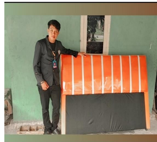
Gambar proses pembuatan meubel TJM furniture