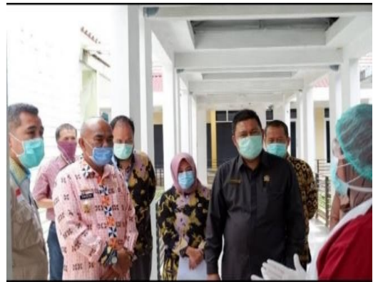
Gambar 2.2 penyuluhan mengenai wabah covid-19