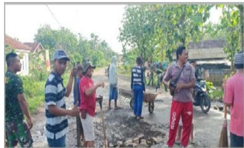
Gambar proses gotong royong