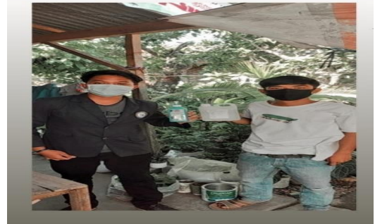
Gambar 2.3 pembagian handsanitaizer

2.3.3 Membantu-bantu dipabrik meubel TJM Furniture didesa Sumber Rejo Sejahtera Kecamatan Kemiling Bandar Lampung cara merakit kayu menjadi bernilai menjadi kursi,meja,kasur dan lain sebagainya dan membantu penjualannya .