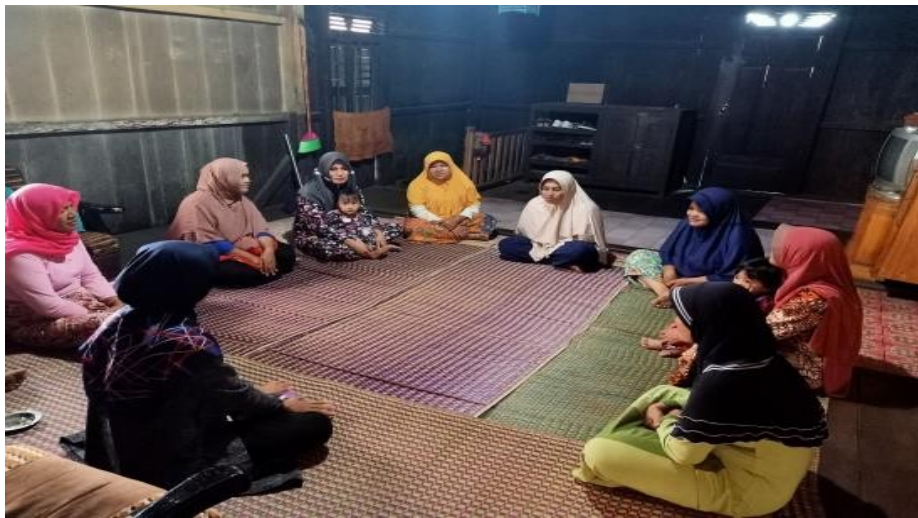
Gambar 2.5 pembuatan handsanitizer menggunakan bahan herbal

Membagikan handsanitizer kepada masyarakat Desa Sumber Rejo Sejahtera Kecamatan Kemiling Bandar Lampung . Selanjutnya membagikan handsanitizer kepada masyarakat Desa Sumber Rejo Sejahtera Kecamatan Kemiling Bandar Lampung dengan harapan pembagian handsanitizer ini digunakan secara maksimal oleh warga, mencuci tangan dengan air dan sabun lebih diutamakan, namun bisa juga memakai handsanitizer untuk membersihkan tangan yang tidak terlihat kotor atau jika memang air dan sabun tidak tersedia.