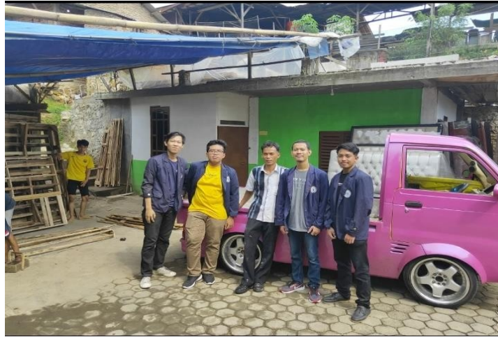
Gambar foto bersama pemilik meubel TJM furniture