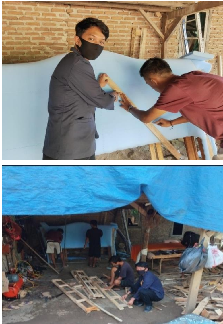
Gambar 2.4 Membantu-bantu membuat kayu meubel menjadi kasur

Membuat handsanitizer dengan bahan- bahan alami yang mudah ditemukan Selanjutnya membuat handsanitizer dengan memanfaatkan bahan-bahan herbal yang mudah didapatkan disekitar rumah warga untuk mencegah penularan virus, sebab handsanitizer mampu mengurangi bakteri, kuman, dan virus yang menempel pada tangan manusia serta kebersihan tetap terjaga dan mengurangi beban ekonomi keluarga ditengah pandemi.