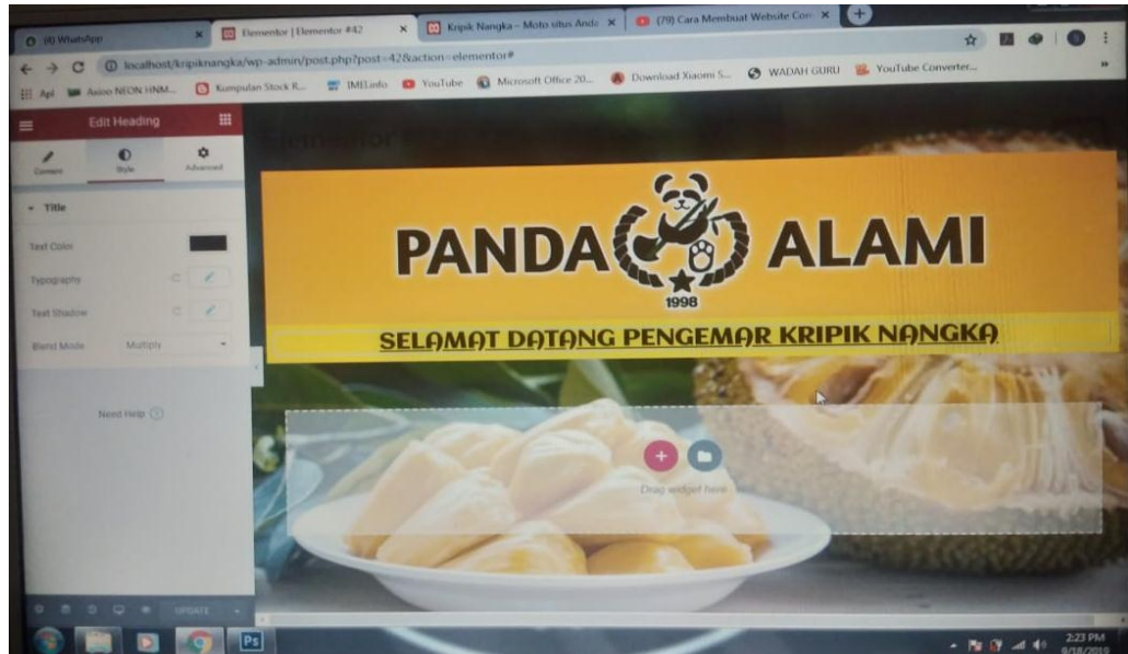
Gambar 3.8 Tampilan Home Web