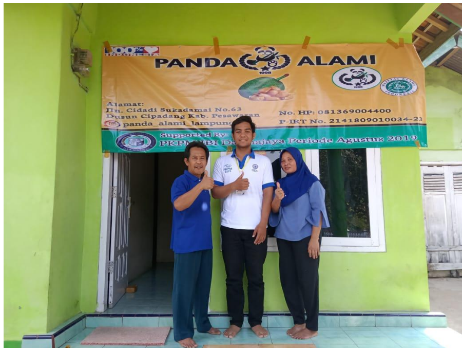
Gambar 3.12 bersama pemilik UKM