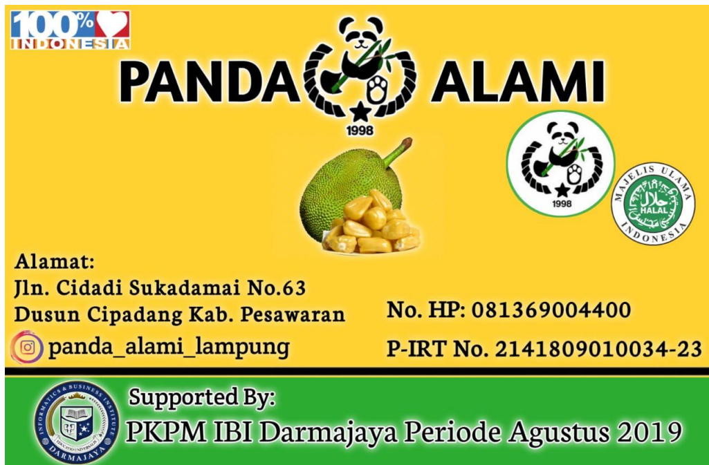
Gambar 3.10 Desain Banner Keripik Panda Alami