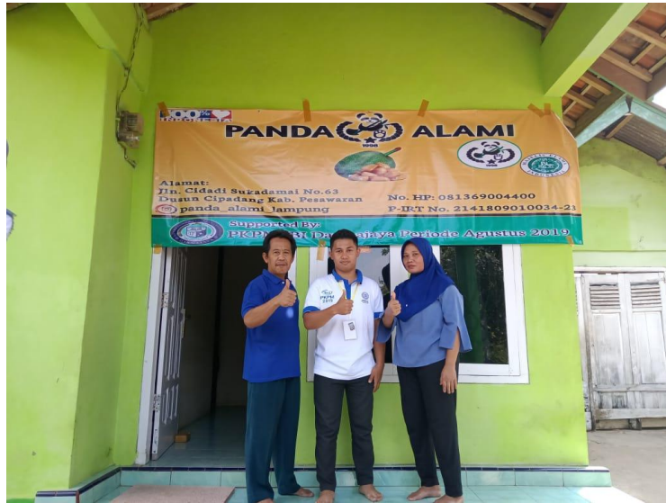
Gambar 3.5 setelah pemberian pelatihan