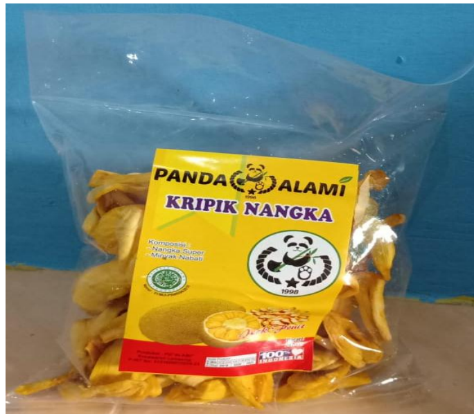
Gambar 3.3 Mutu Produk Kripik Nangka