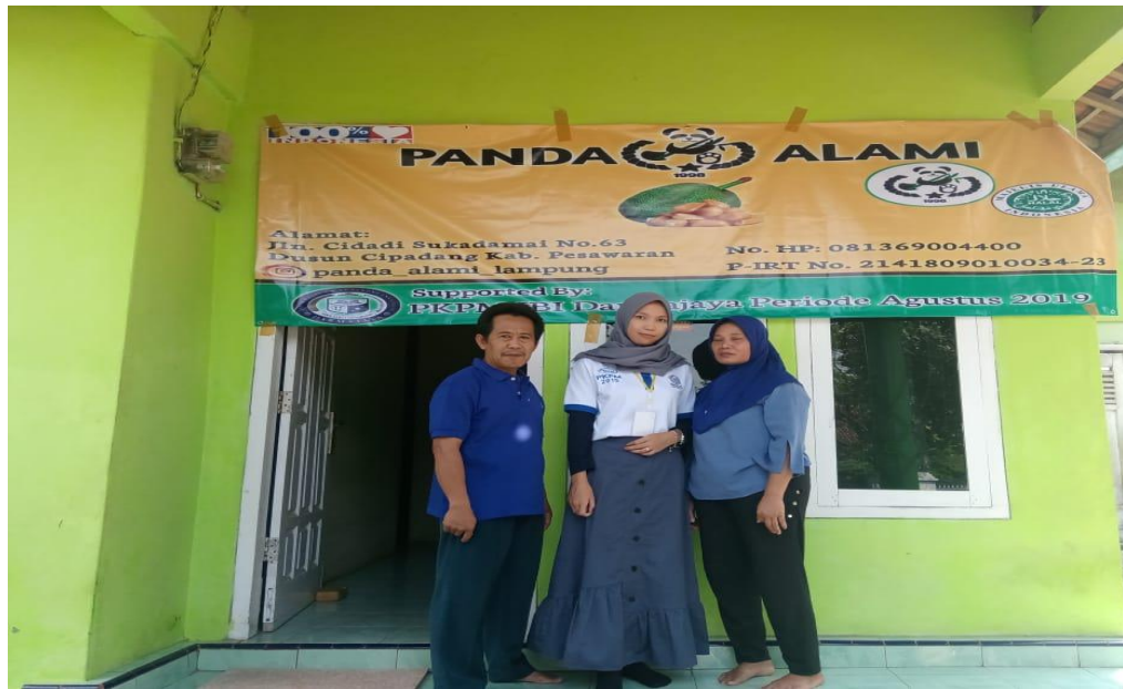
Gambar 3.11 bersama pemilik UKM