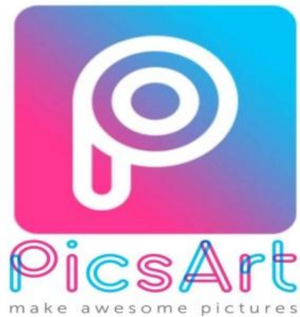
Gambar 3.9 aplikasi yang digunakan