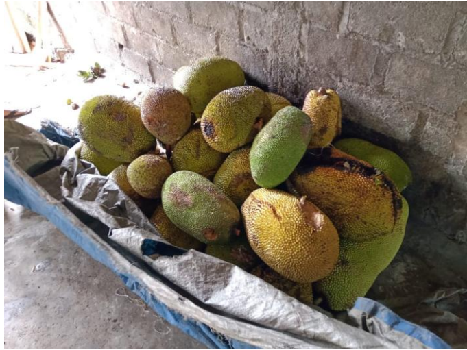
Gambar 3.1 Nangka yang di jadikan sebagai Kripik

nangka dari supliyer nangka yang sudah bekerja sama dengan UKM Panda Alami.