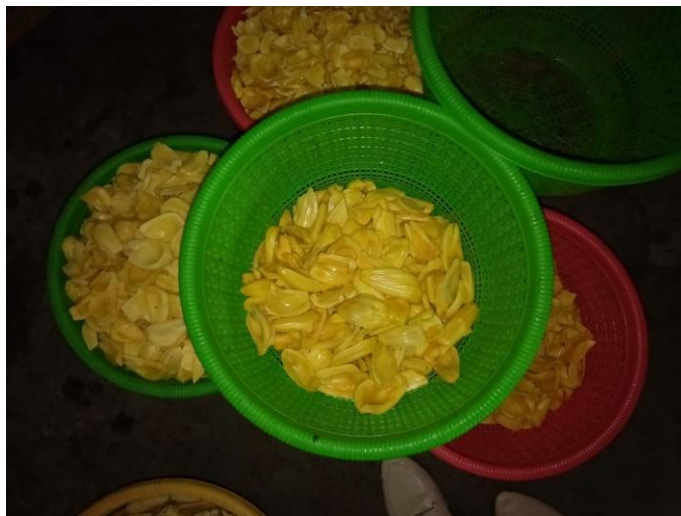
Gambar 3.2 Nangka yang sudah di kupas