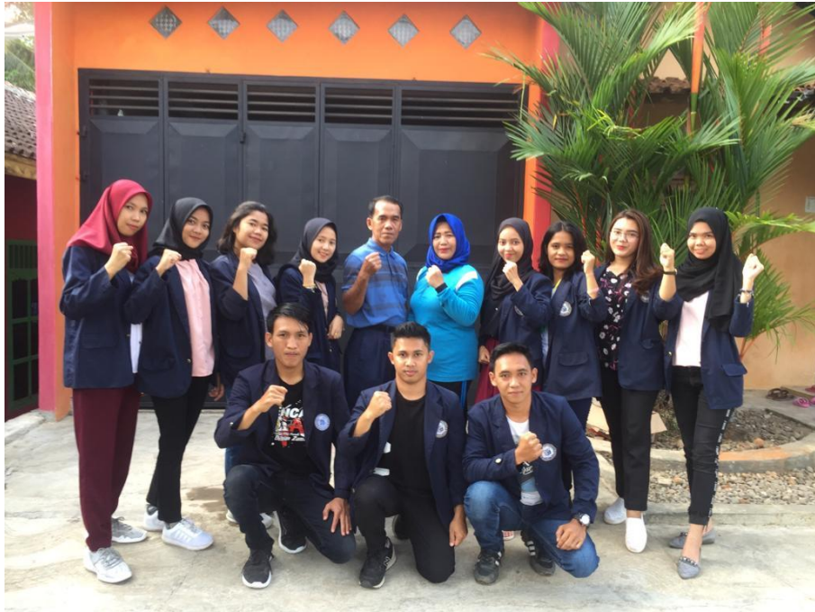
Gambar 3.13 selagi mendokumentasi profil desa