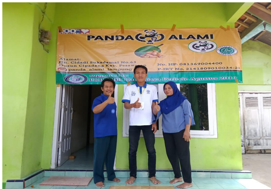
Gambar 3.6 bersama pemilik UKM