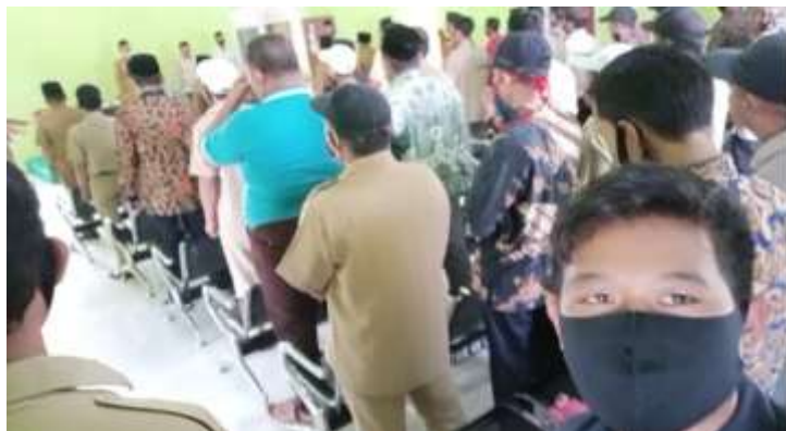
gambar 3: Pelantikan ketua RK

Mengikuti kegiatan desa , Pelantikan ketua Rk , dan mengetahui seluruh ketua rk yg akan memimpin di setiap dusun gedung karya jitu