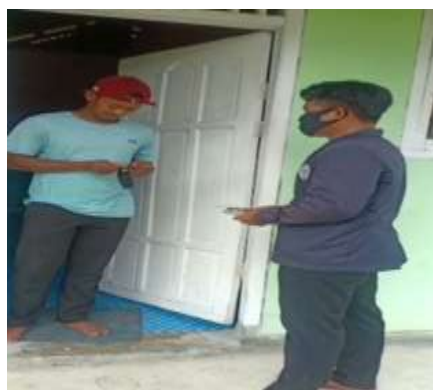
Gambar 3: Sosialisasi COVID 19

Sosialisasi kepada masyarakat melalui rumah ke rumah dan membagikan masker guna mensosialisasikan bahaya covid 19 dan membagikan masker untuk memutus rantai penyebaran covid 19