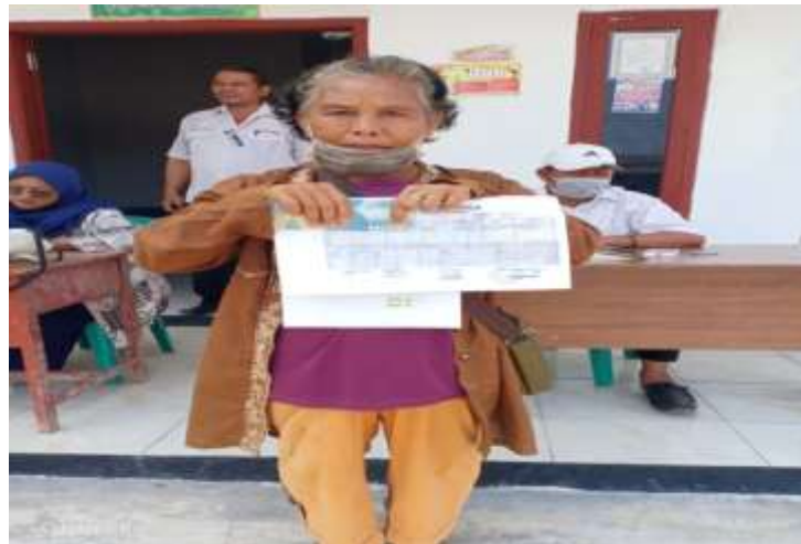
GAMBAR 4: Pembagian dana BLT

Membantu pemerintahan desa Pembagian dana Bantuan Langsung Tunai (BLT) , BLT adalah program bantuan pemerintah berjenis pemberian uang tunai atau beragam bantuan lainnya, baik bersyarat (conditional cash transfer) maupun tak bersyarat (unconditional cash transfer) untuk masyarakat miskin.