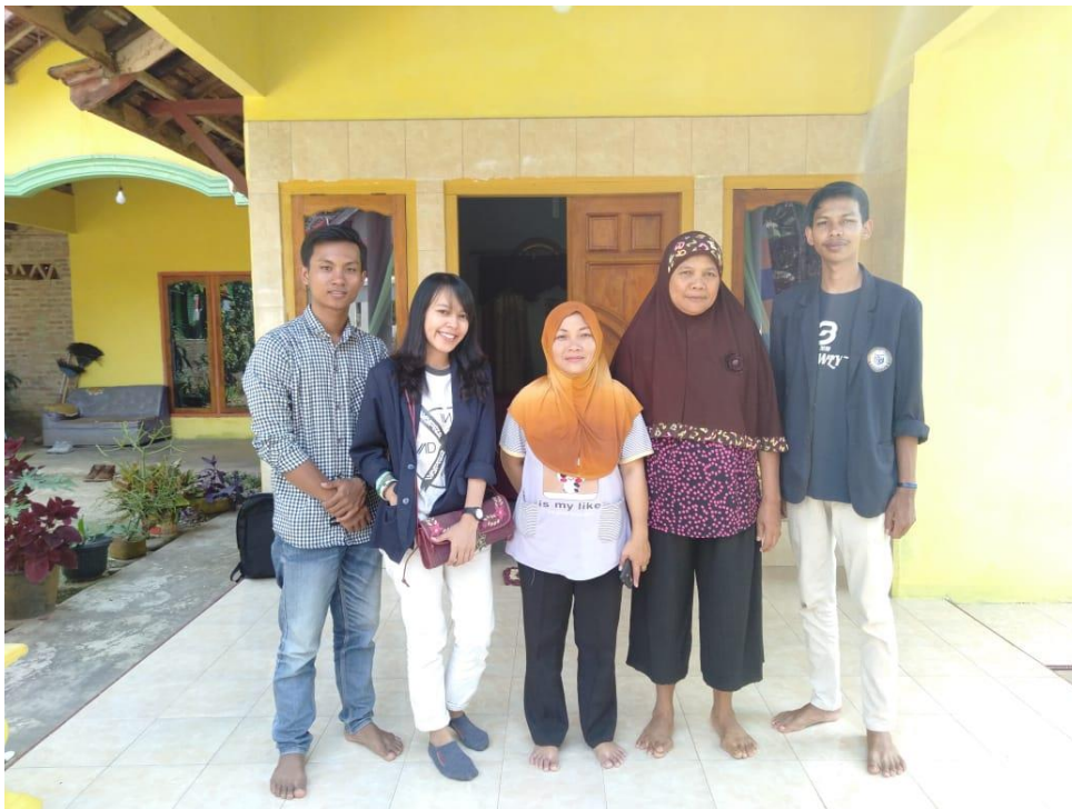
Gambar 11. Foto survei tempat tinggal didesa cipadang