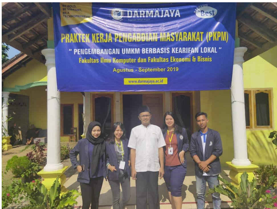
Gambar 12. Foto bersama dengan Dosen Pembimbing Lapangan