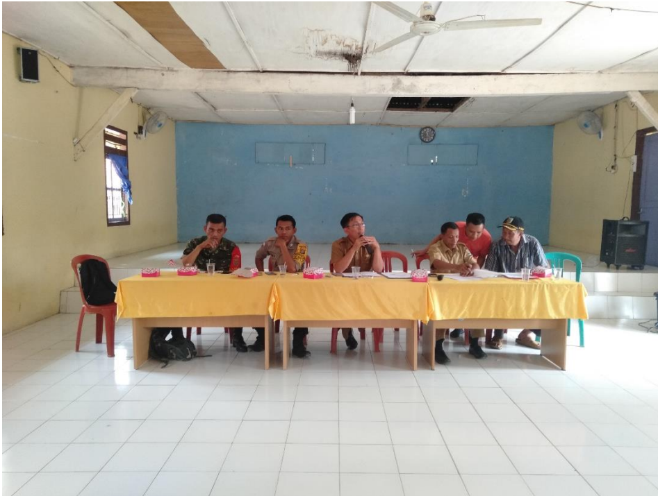
Gambar 13. Foto Menghadiri Bumdes Desa cipadang