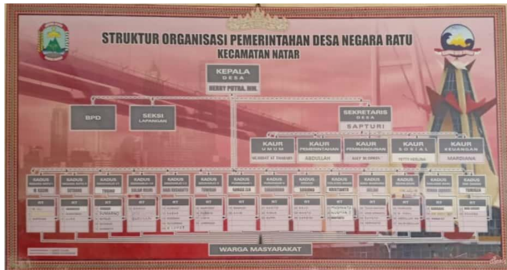
Gambar 2.2 : Struktur Pemerintahan Desa Negara Ratu.