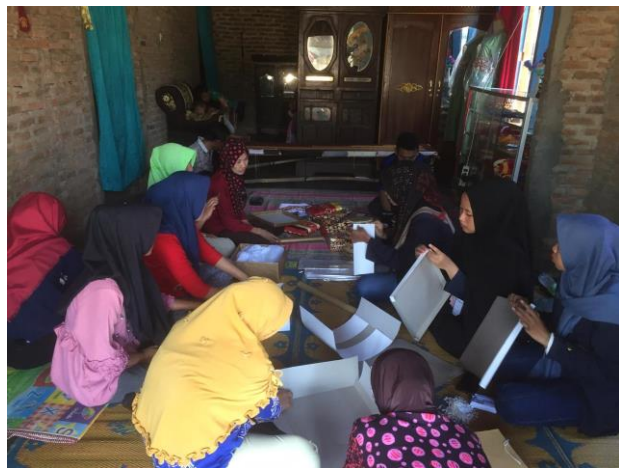
Pelatihan dan penyerahan website UMKM kepada struktur UMKM Tapis Kilu Andan