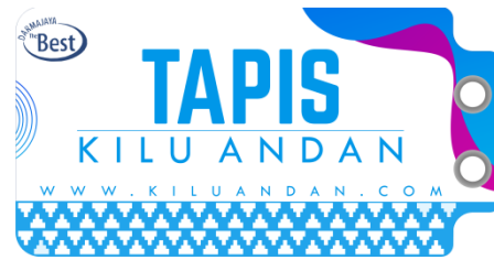
Desain label dan hang tag untuk produk Tapis Kilu Andan