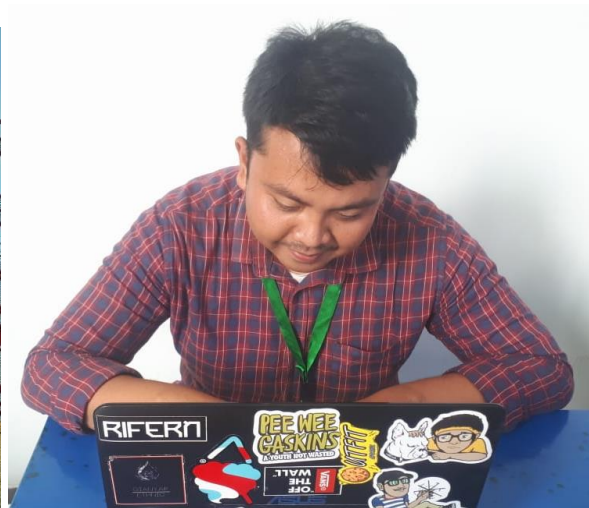
Proses pembuatan dan editing video untuk UMKM dan desa