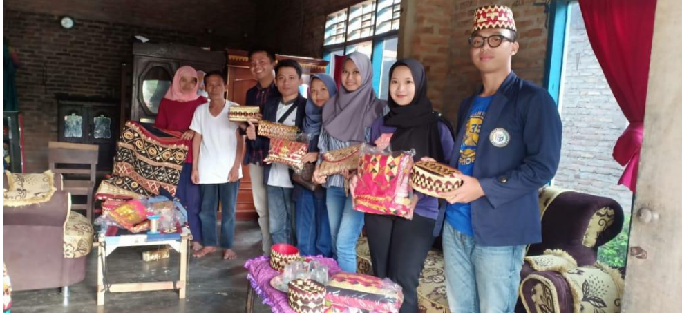
Kunjungan pertama di UMKM Tapis Kilu Andan Desa Batu Raja