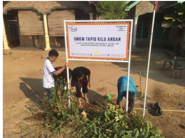
Proses pemasangan Plang UMKM Tapis Kilu Andan