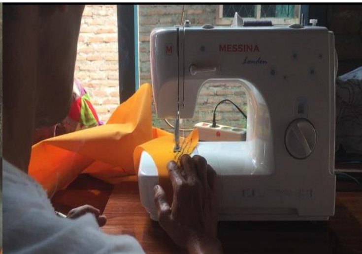
Proses menjahit kain tapis agar lebih rapi dan kuat