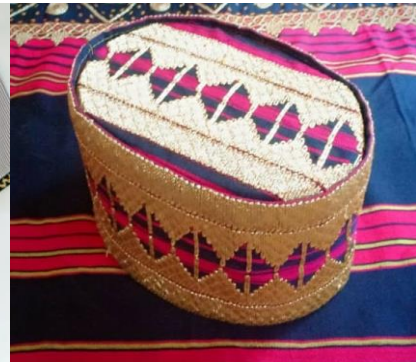
Hasil produk yang telah dibuat