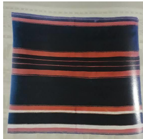
Benang Tapis dan bahan dasar kain yang digunakan untuk menapis