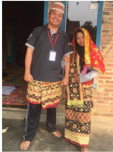
Contoh pemakaian 1 set Baju Tapis khas pengantin adat Lampung