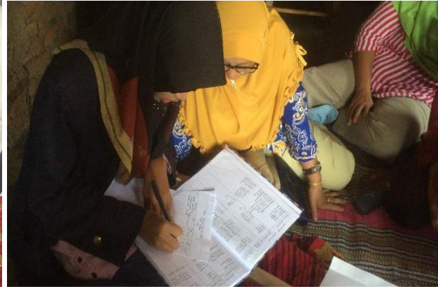
Proses pembelajaran tapis dan pelatihan penyusunan laporan keuangan di UMKM