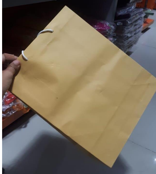
Inovasi packing pada kemasan