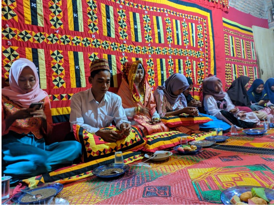
Penggunaan Kebung Tikhai saat acara adat